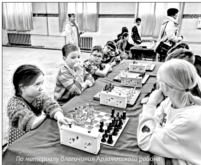
По материалу благочиния Арзамасского района