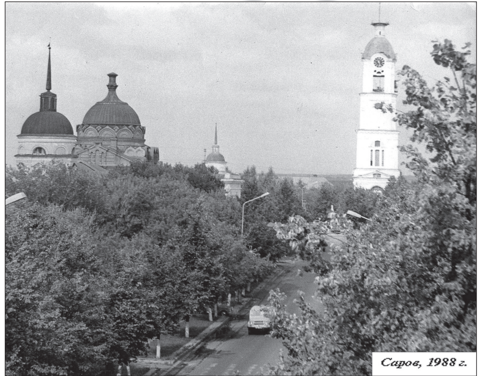
Саров, 1988 г.

Учителя заметили во мне задатки творческой личности и отправляли участвовать то в городском конкурсе на лучше-