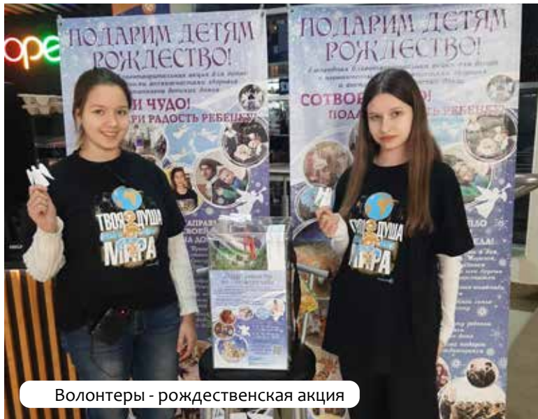
Волонтеры - рождественская акция

◆ В храм Всех Святых требуются: просфорница, рабочий, алтарник, уборщица, продавец за свещной ящик. Тел.: 8(83130)7-70-77 (храм Всех Святых).