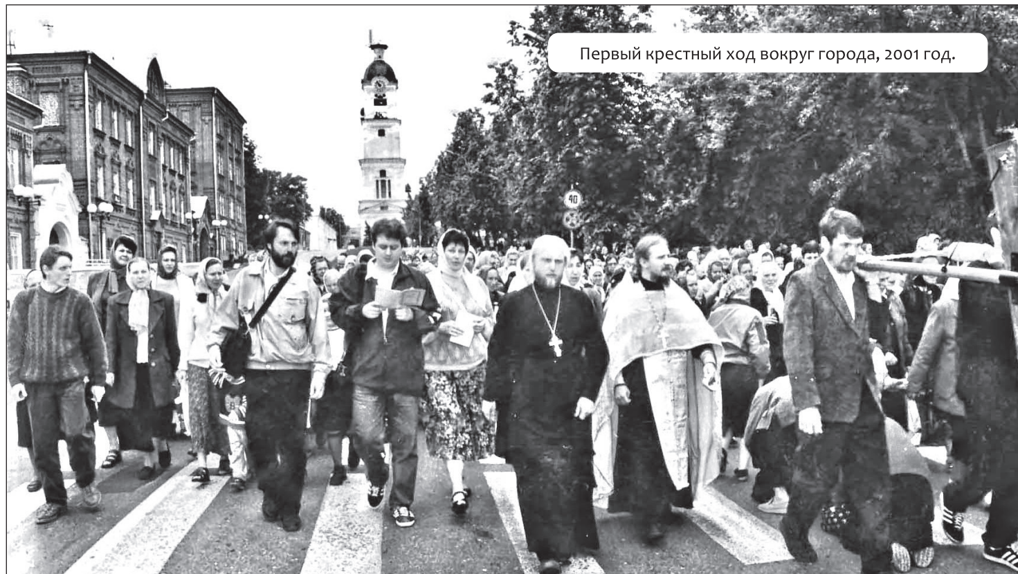
Первый крестный ход вокруг города, 2001 год.