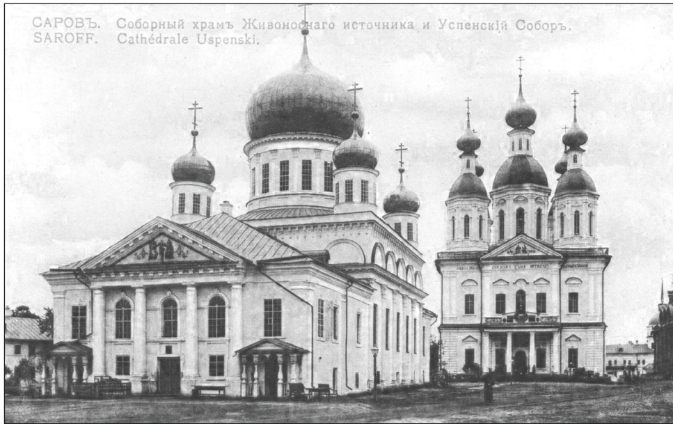
САРОВЪ. Соборный храм Живоносного источника и Успенский Соборъ. SAROFF. Cathédrale Uspenski.

2 июня 2023 года митрополит Нижегородский и Арзамасский Георгий освятил последнюю восстановленную в Свято-Успенском мужском монастыре — Саровской пустыни церковь — собор в честь иконы Божией Матери «Живоносный Источник». Расскажем об истории этого храма в преддверии дня основания обители, которое произошло 317 лет тому назад.