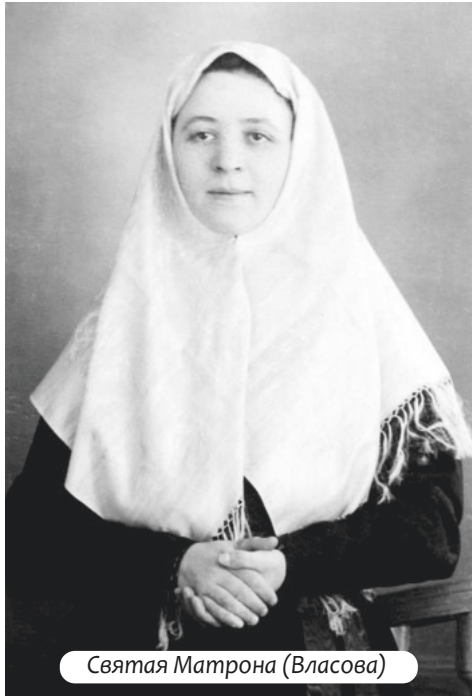
Святая Матрона (Власова)