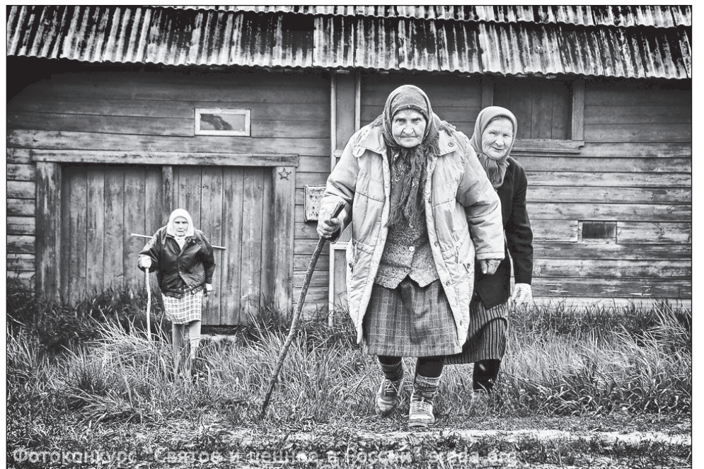
Фотоконкурс «Святое и ценное в России» sveda.org