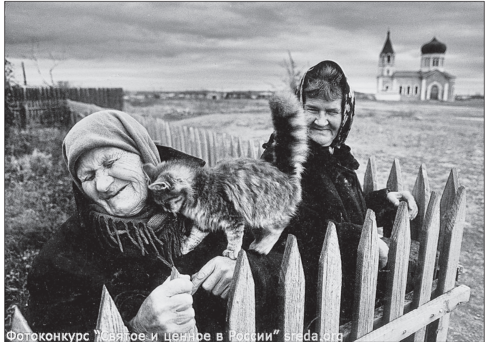
Фотоконкурс «Святое и ценное в России» sveda.org