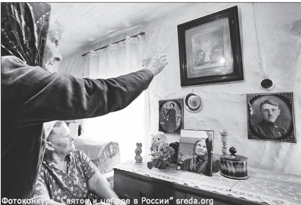
Фотоконкурс «Святое и ценное в России» sveda.org