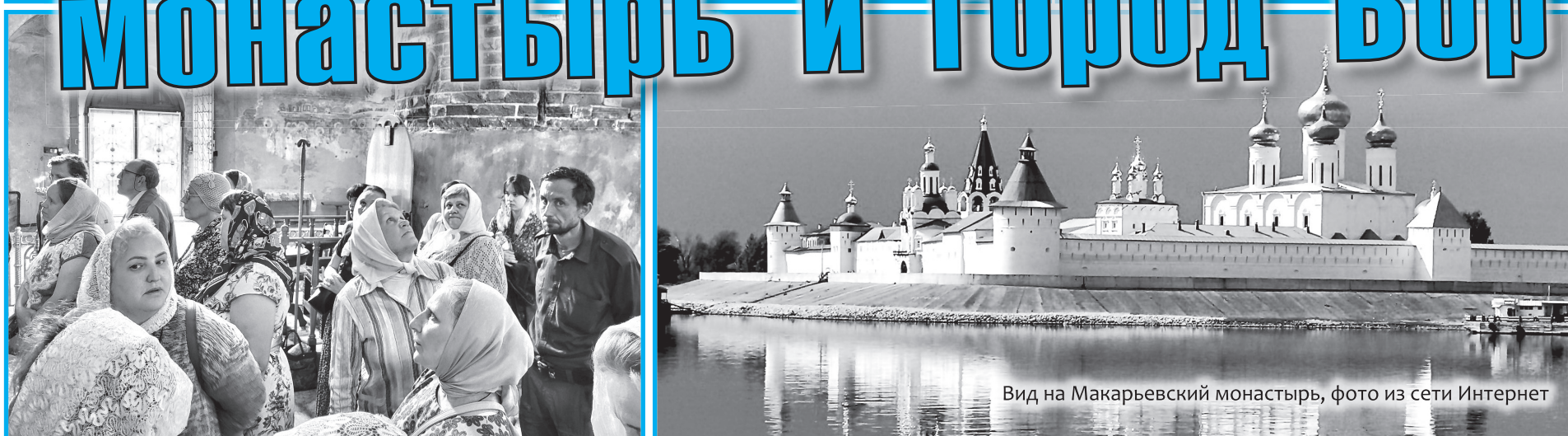
Вид на Макарьевский монастырь