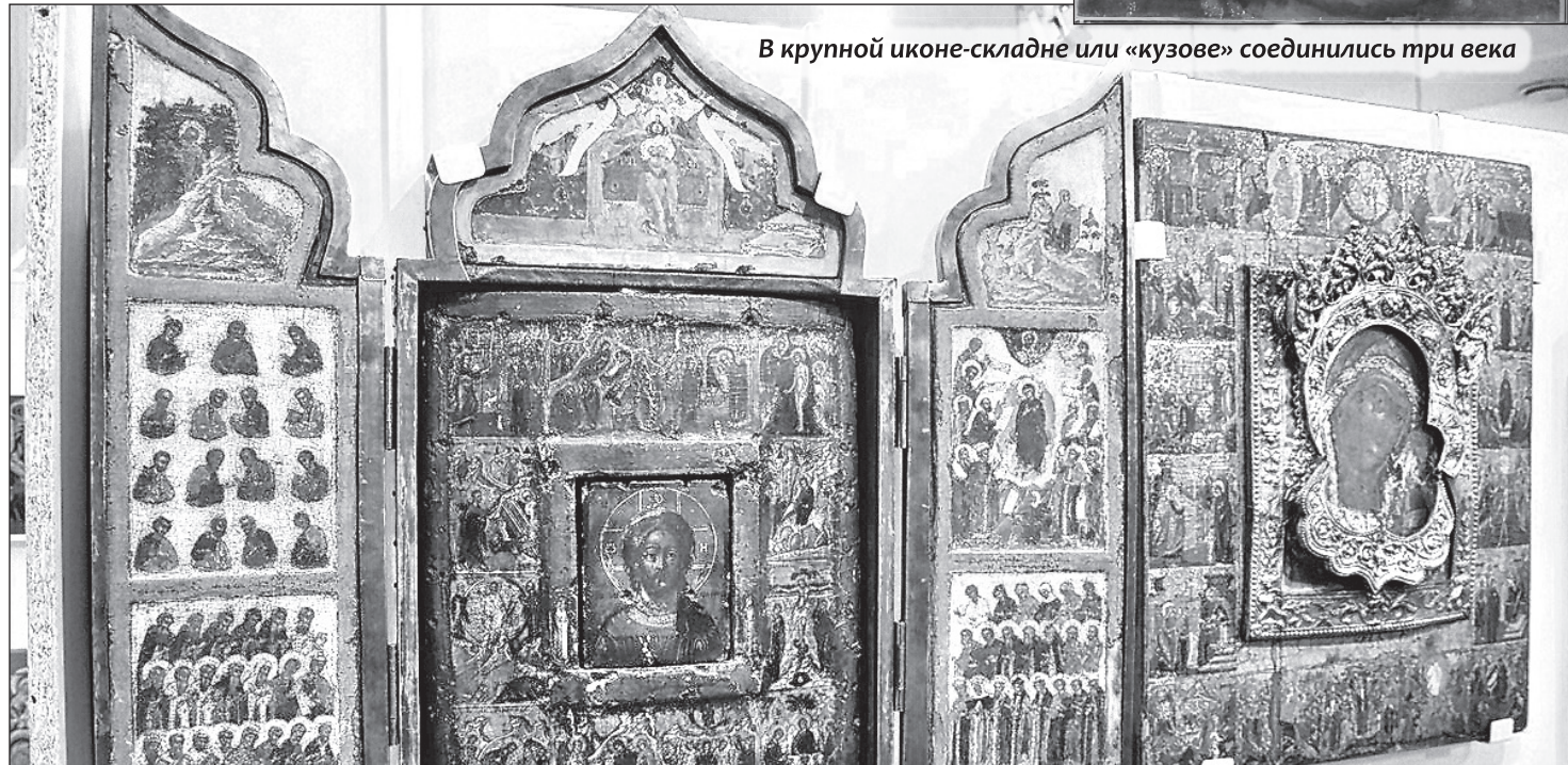
В крупной иконе-кладне или «кузове» соединились три века

мирская икона Божией Матери XVII века с шитым окладом!