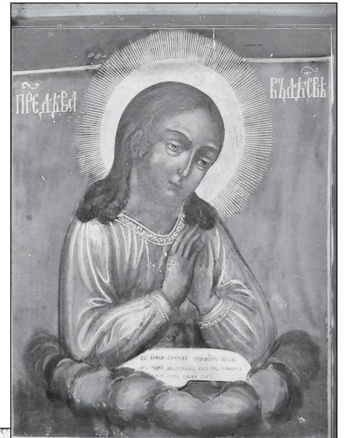
В крупной иконе-кладне или «кузове» соединились три века

нет, даже когда отмечали «Ночь музеев». Мы тогда немного посидели, а потом поехали в Маяковку, в музей Военно-мор-