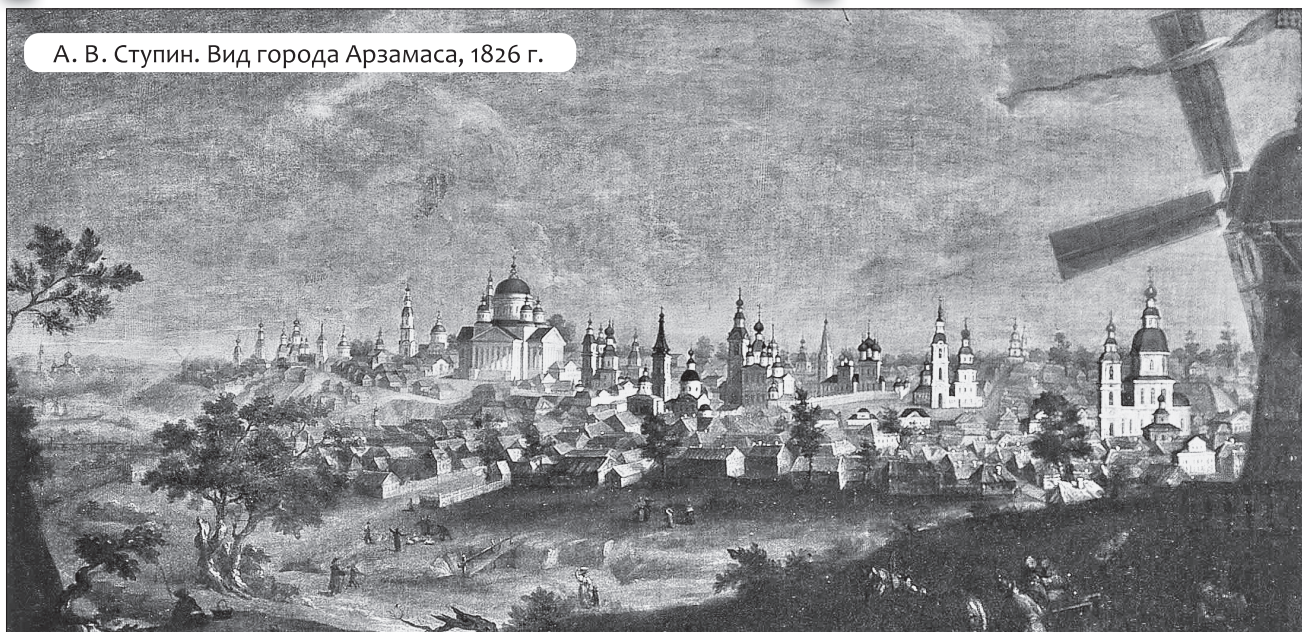
А. В. Ступин. Вид города Арзамаса, 1826 г.

Картина была на подрамнике в мастерской — нежилой комнате, где художник работал, там же хранились его законченные работы. Высокий мольберт, большая каменная плита с курантом (каменным пестиком для растирания красок), палитра, кисти... Ночью в дом пробрались похитители. Они выставили оконную раму, срезали