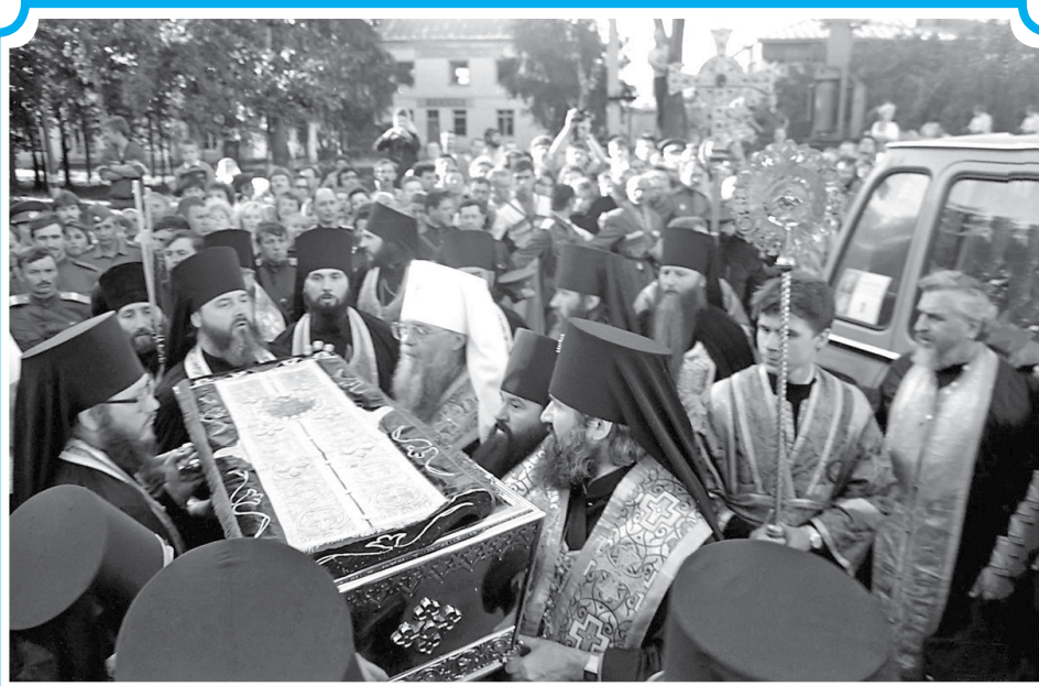
30 июля 1991 года в Дивеевский монастырь прибыл крестный ход со святынями мощами прп. Серафима Саровского. На праздничные богослужения собралось около 10 тысяч паломников.

Для доставки мощей преподобного в Москву был выделен специальный вагон поезда. Когда процессия с крестным ходом подошла на вокзал, мы увидели, что все перроны и подходы к зданию вок-