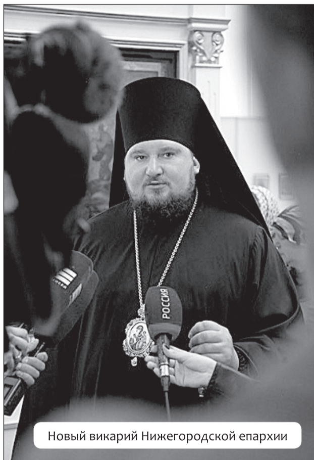
Новый vikarий Нижегородской епархии

Члены Синода выделили в Самарской области новую Тольяттинскую епархию, а также постановили включить в повестку дня очередного Архиерейского Собора вопрос об общецерковном прославлении прп. Гавриила Седмиезерного (Зырянова). Священный Синод сделал заявление в поддержку епархий Сербского Патриархата на территории Черногории, которые страдают от раскольнической деятельности т. н. «Черногорской православной церкви», усиления дискриминации и давления властей на каноническое духовенство и верующих.