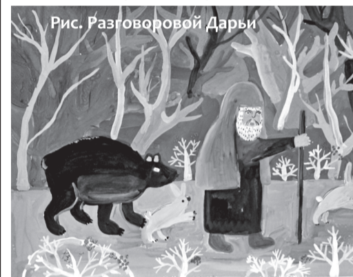
Рис. Разговоровой Дарьи

На конкурс были представлены 38 рисунков, восемь экскурсионных буклетов, девять исследовательских работ и три сценария мультфильма. Свои работы прислали учащиеся в возрасте от 8 до 18 лет из восьми православных гимназий Нижегородской митрополии, трех муниципальных школ и Центра внешкольной работы города Сарова.