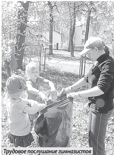
Трудовое послушание гимназистов