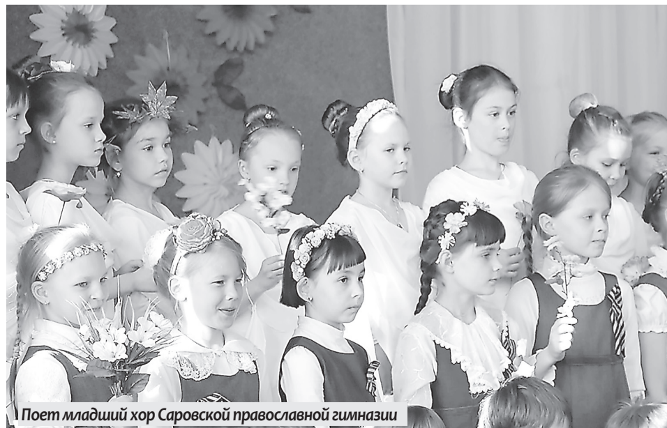
Поет младший хор Саровской православной гимназии