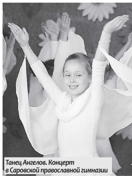
Танец Ангелов. Концерт в Саровской православной гимназии

Остальные классы привели в порядок территорию вокруг самой православной гимназии, которая была разбита на участки для каждого класса. Ребята трудились вместе с родителями и педагогами. Дружно убрали мусор, чисто подмести, перекопали клумбы и высадили много цветов. Дети помогали поливать растения. Взрослые вырезали раз-