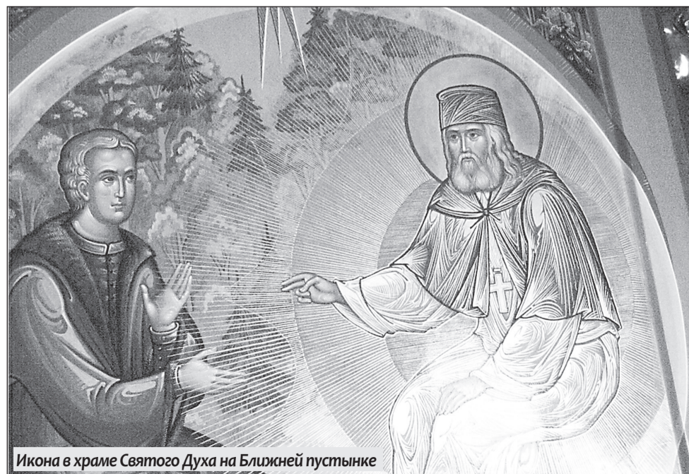
Икона в храме Святого Духа на Ближней пустынке