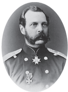
Александр II. Лагосветный портрет. Савелина 1860-х гг.

29 апреля исполняется 200 лет со дня рождения императора Александра II (1818–1881), который вошел в отечественную историю как выдающийся реформатор, и главная из его реформ — отмена крепостного права. Правление Александра II ознаменовалось достижениями во внешней политике, победоносными войнами