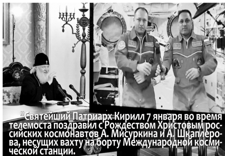
Святейший Патриарх Кирилл 7 января во время телемоста поздравил с Рождеством Христовым российских космонавтов А. Мисуркина и А. Шкаплера, несущих вахту на борту Международной космической станции.