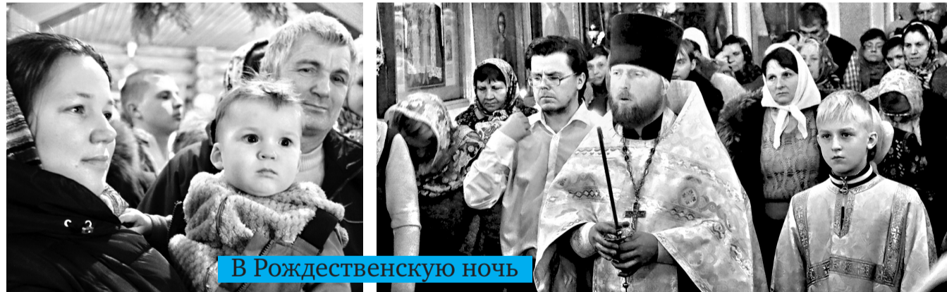
В Рождественскую ночь

Третье — у нас в 50 субъектах РФ люди получают денежные выплаты на третьих и последующих детей до достижения ими трех лет.