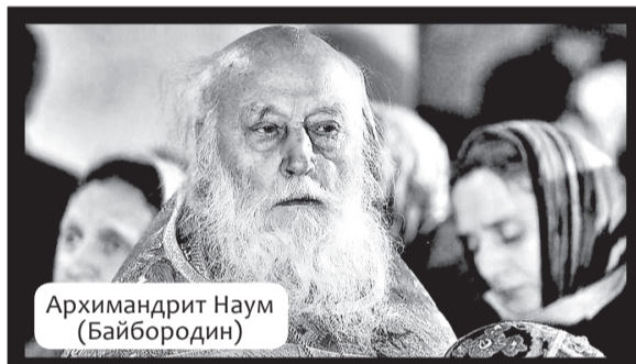
Архимандрит Наум (Байбородин)

14 октября в Спасо-Преображенской (Карповской) церкви Н. Новгорода состоялся традиционно совершаемый в этот праздник чин освящения клинкового казачьего оружия. Казаки приняли участие и в праздничном концерте, прошедшем на территории прихода. Они продемонстрировали владение казачьими шашками, элементы рубки.