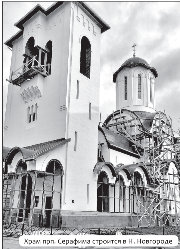
Храм прп. Серафима строится в Н. Новгороде