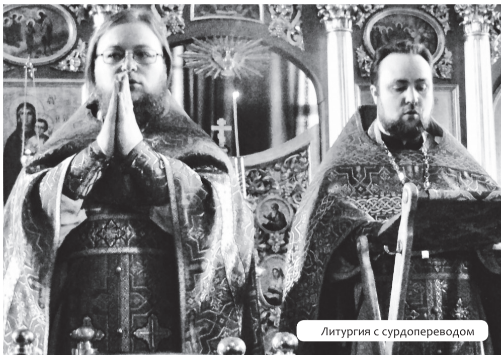
Литургия с сурдопереводом