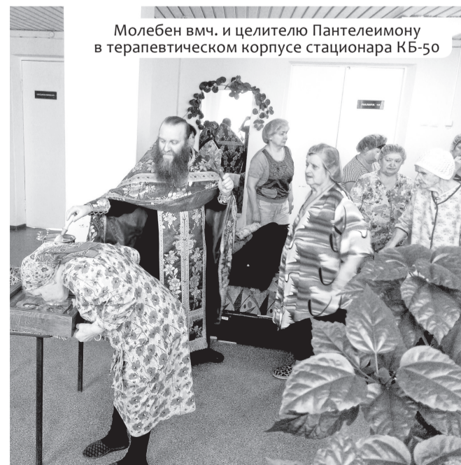
Молебен вмч. и целителю Пантелеимону в терапевтическом корпусе стационара КБ-50

ствовала в практическом семинаре на базе Спасо-Преображенской церкви Н. Новгорода. Там были проведены два открытых урока: по Священной библиейской истории для дошкольников и по Новому Завету для учащихся начального звена. Также был представлен опыт организации летнего семейного лагеря.