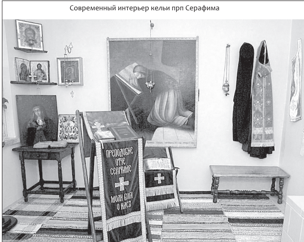
Современный интерьер келии прп. Серафима

дя к двери келии, я нашел ее запертой изнутри и, по обыкновению, громко произнес молитву: «Господи Иисусе Христе, Боже наш, помилуй нас!» — что, как известно, на монастырском языке равносильно просьбе войти, — на что мне отвечали «аминь», т. е. «войди», и отперли дверь. До того времени я видел эту келию не иначе, как наполненную народом, теснившимся принять благословение от Серафима, а потому заметил только передний ее угол, уставленный образами с горевшими перед ними лампадами, под образами стол, на котором лежали свечи, а под столом просфоры, бутылки с церковным вином и деревянным маслом — и ничего более; да меня занимала, конечно, не келия и ее обстановка и даже не хозяйин ее, а публика, теснившаяся около него, — но тут я был один перед старцем, и меня поразило странное зрелище: посредине келии стоял гроб, и в гробу сидел почтенный старец Серафим, держа в руках книгу. Он чрезвычайно приветливо обратился ко мне со словами: