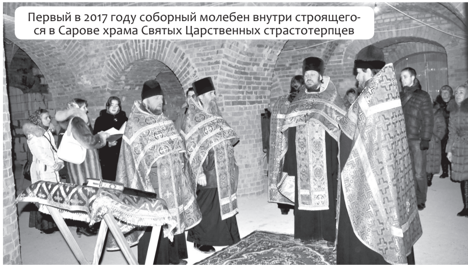
Первый в 2017 году соборный молебен внутри строящегося в Сарове храма Святых Царственных страстотерпцев