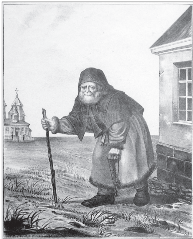
Прп. Серафим Саровский, идущий в храм. 1880 г. Литография Серафимо-Дивеевского монастыря.

зал ей: «А ты пальчиком-то, матушка, пальчиком!» — т. е. ложку приставь только ко рту, а содержащееся в ней переложи в рот рукою, — но при этом совете молодая особа засмеялась, а вслед за нею начал и я громко хохотать, так что почтенный старец отошел от нее в недоумении, и она тотчас вышла из келии; а так как мой хохот не унимался, несмотря на все старания матери прекратить его, то я выведен был ею также вон и получил сильный нагоняй за мое неприличное поведение: меня оставили без чаю и без обеда, и матушка объявила мне, что она не простит меня до тех пор, пока я не получу прощение от отца Серафима, и меня послали к нему после обеда. Конечно, я отправился только по настоятельному требованию, а не по внутреннему призванию, — и под надзором матери, следившей за мною. Подой-