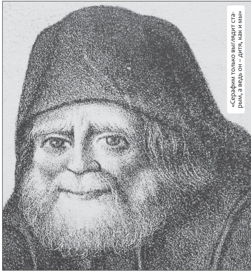
«Серафим только выглядит старым, а ведь он — дитя, как и мы!»