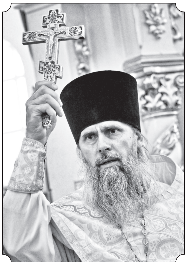
Фотовзгляд. Рождество в храме СЯТОГО ПАНТЕЛЕИМОНА