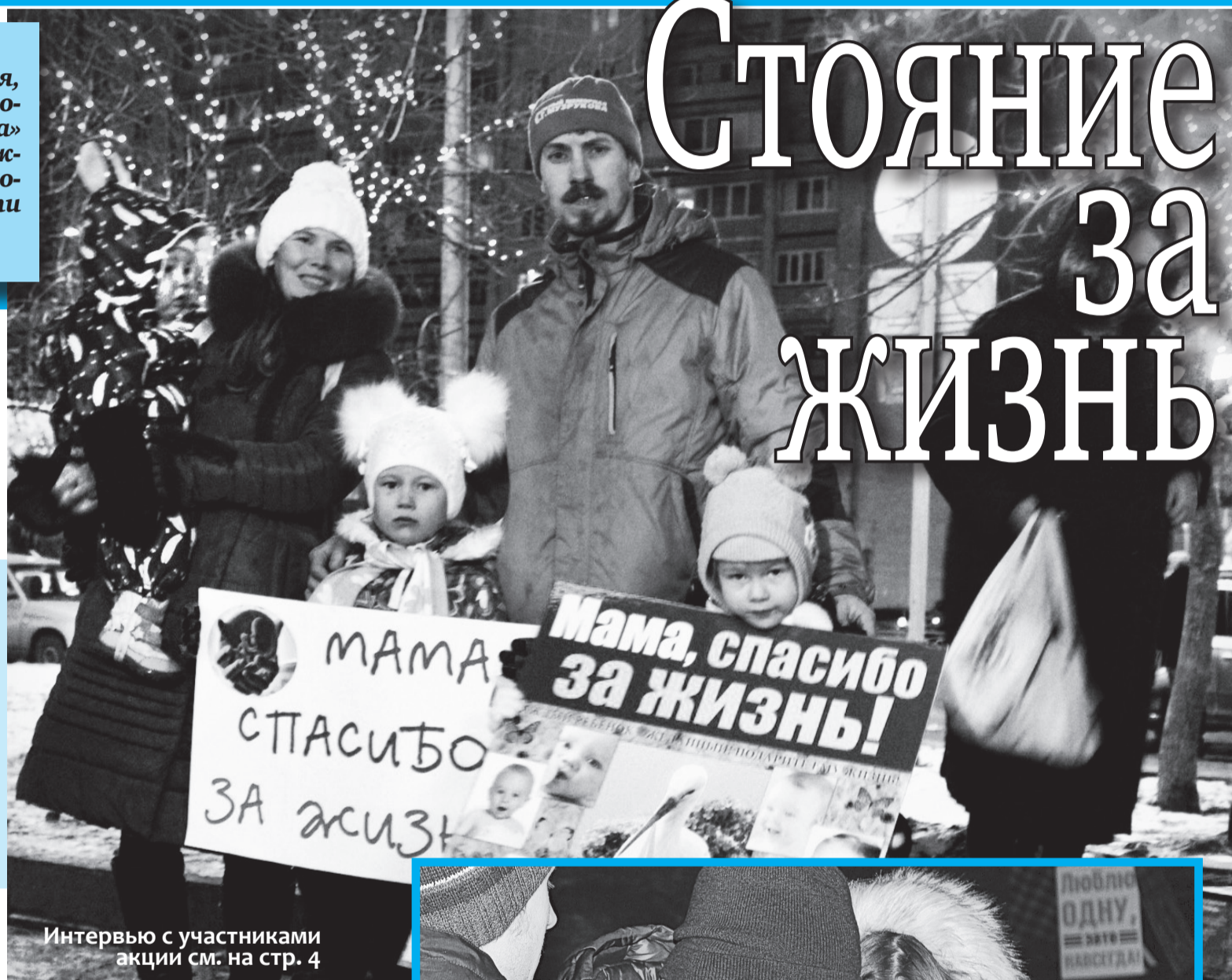
Интервью с участниками акции см. на стр. 4