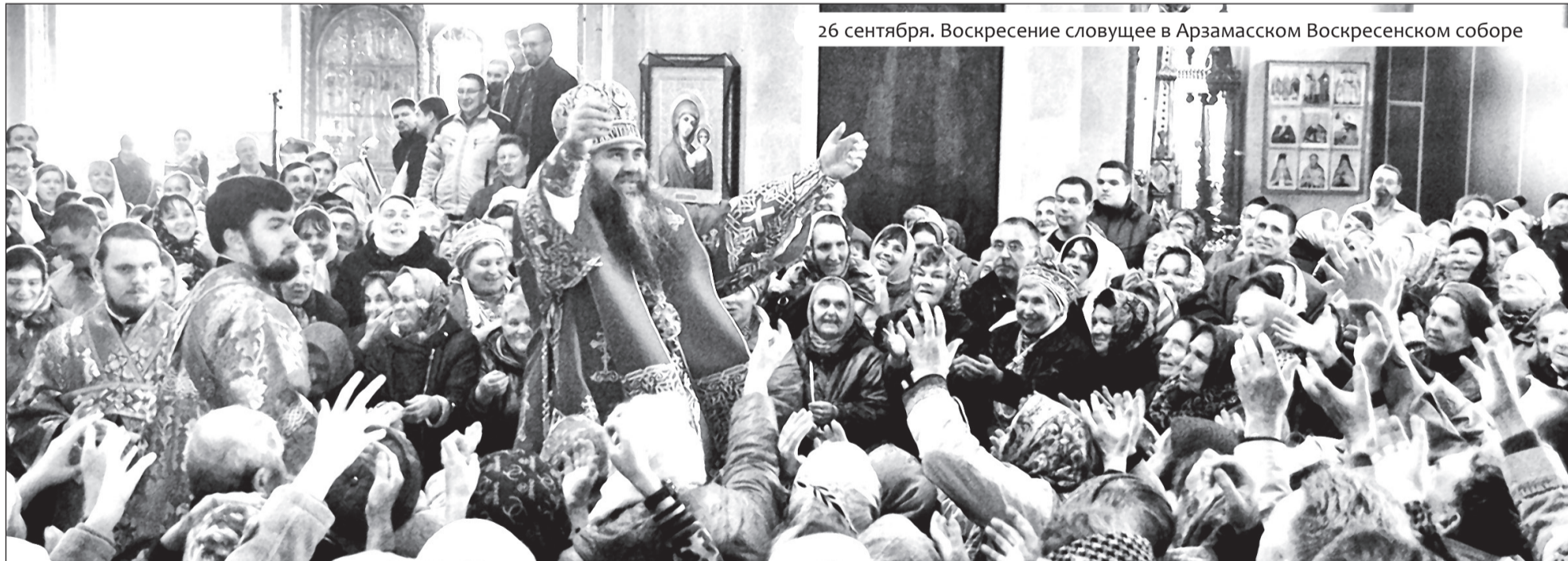
26 сентября. Воскресение словущее в Арзамасском Воскресенском соборе

● 11 сентября , в праздник Усекновения главы Иоанна Предтечи, уже третий раз по центральной части Н. Новгорода прошел крестный ход «За жизнь, семью и трезвую Россию», посвященный всероссийскому Дню трезвости. В молитвенном шествии от ул. Большой Покровской до церкви Иоанна Предтечи участвовали активисты межрегиональной благотворительной общественной организации социальной адаптации граждан «Шаг к жизни», действующей при Сергиевском храме Н. Новгорода. Прохожим раздавались буклеты «Правда и ложь об алкоголе», подготовленные волонтерским движением «Милосердие» и ООО «Трезвение». Впереди верующие несли икону «Неупиваемая чаша» и хоругви.