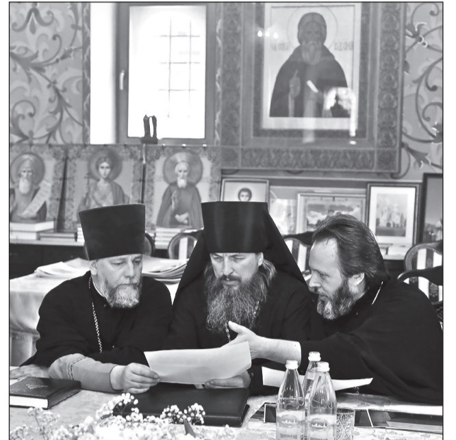
Участники оргкомитета по подготовке и проведению визита в Нижегородскую епархию Святейшего Патриарха Кирилла 21 июня обсудили вопросы, связанные с празднованием дня памяти прп. Серафима Саровского в Дивееве и Сарове. Заседание провел митрополит Георгий в архиерейской резиденции в Вознесенском Печерском мужском монастыре Нижнего Новгорода.

В нашем городе интерес к Школе рукопашного боя вырос настолько, что воспитанникам стало тесно в подвальном помещении. Из-за этого Илья Алексеевич пока