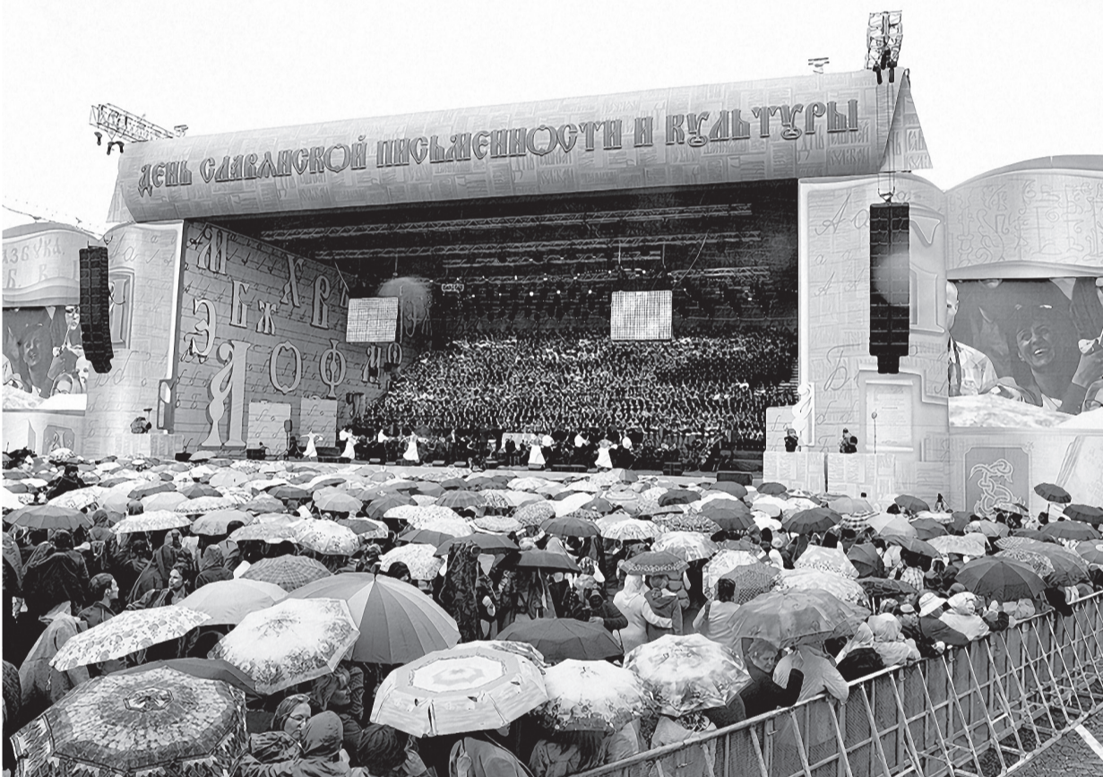
24 мая всероссийский праздничный концерт, посвященный Дню славянской письменности и культуры, прошел одновременно во всех регионах страны от Владивостока до Калининграда. Основное торжество состоялось на Красной площади в Москве.

26 мая в Казани состоялась презентация первого полного перевода Библии на татарский язык. Это – шестой перевод полной Библии на титульный язык народов РФ после русского, чувашского, тувинского, удмуртского, чеченского языков. Работа над переводом на татарский язык велась более 23 лет. Перевод прошел научное рецензирование. Общий тираж издания – 8 тыс. экземпляров.