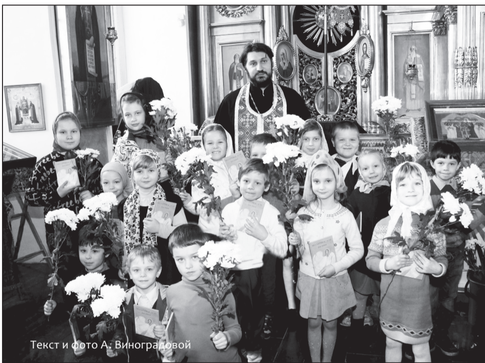
Текст и фото А. Виноградовой

Всегда спрашивают, как ребенку поститься, надо ли «вычитывать правило» и стоять на вечерней службе накануне. Но как важно за внешней формой не потерять смысла действий! Батюшка поясняет: «Ре-