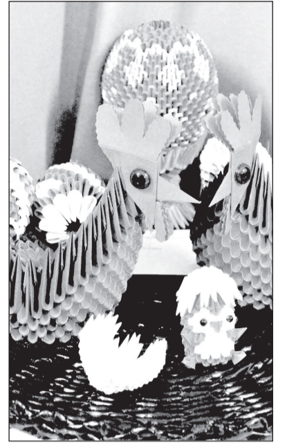
М. Куракина, фото автора

Все участники конкурса (независимо от места) будут награждены благодарственными письмами. Но не все работы были правильно поданы. Поэтому организаторы конкурса просят до 6 мая прийти в ПТО «Мир» (предварительно позвонив по телефону 89108802400), забрать работы и дипломы, проверив правильность их заполнения.