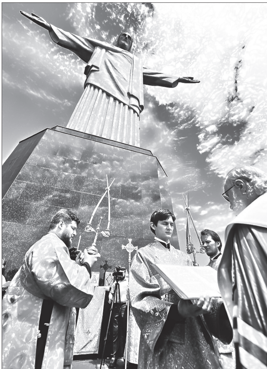
Патриарх Кирилл совершил молебен о гонимых христианах у подножия статуи Христа-Искупителя на вершине горы Корковаду в Рио-де-Жанейро.

Мы не знаем, как пройдет Всеправославный собор, не знаем, каким будет наш стремительно меняющийся мир завтра, но в Послании последнего Архиерейского Собора говорится, что «забота о соблюдении церковного единства является обязанностью каждого православного христианина». И еще. Нас просят «возносить усердные молитвы о том, чтобы Господь явил Свою святую волю членам предстоящего Святого и Великого Собора Православной Церкви и чтобы его проведение послужило к славе Божией, к пользе для всемирной православной семьи и к укреплению ее единства, к сохранению чистоты святейшей веры нашей».