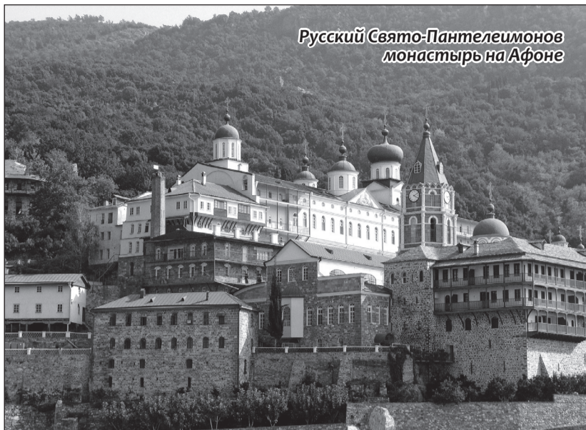
Русский Свято-Пантелеимонов монастырь на Афоне

Мы хотим познакомить читателей с некоторыми работами ребят на VI Серафимовских детских чтениях. Они помогут хоть немного почувствовать особенную атмосферу Чтений. Причем мы выбрали работы детей, которые учатся не в православных гимназиях, а в муниципальных школах.