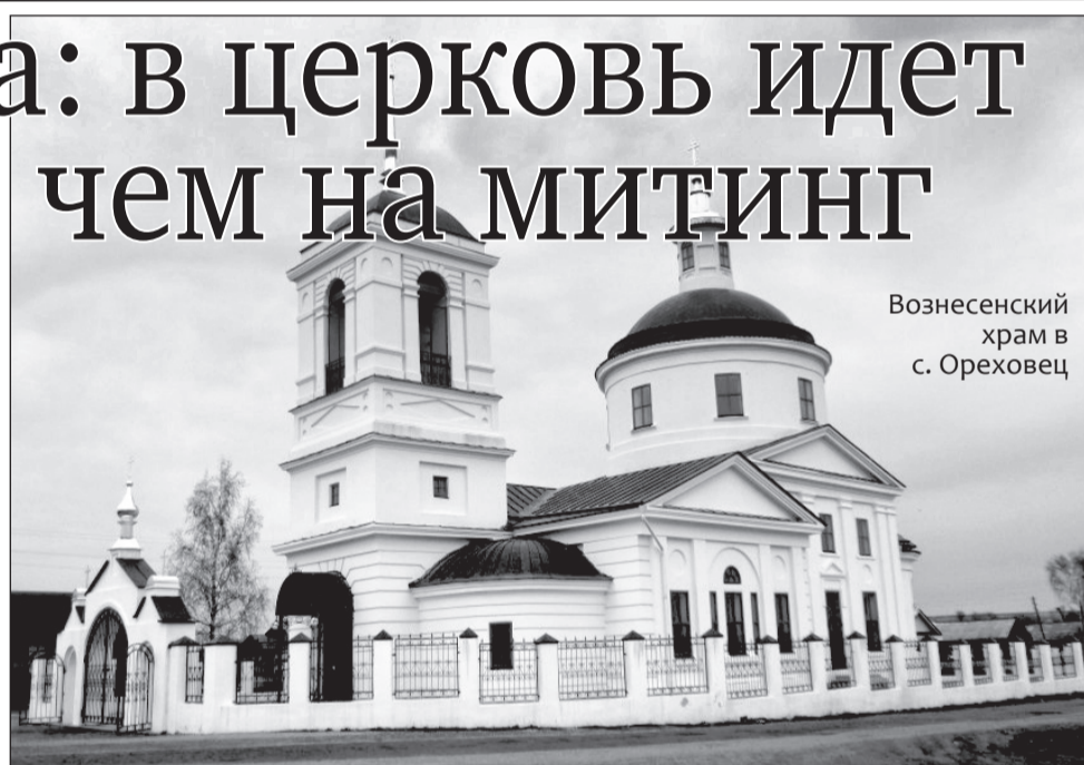
Вознесенский храм в с. Ореховец