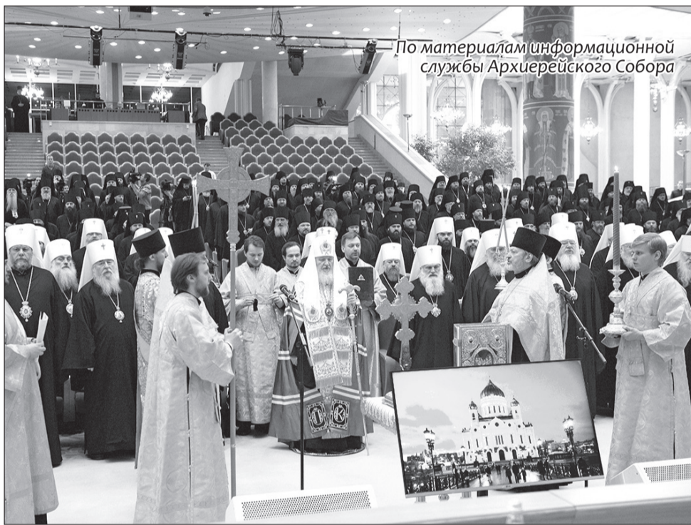
По материалам информационной службы Архиерейского Собора

Архиерейский Собор выразил поддержку верующим Украинской Православной Церкви, а также благодарность тем, кто помогал беженцам или оказывал помощь пострадавшим на Юго-Востоке Украины. Святейший Патриарх Кирилл призвал Полноту Русской Церкви продолжить молиться о мире на Украине.