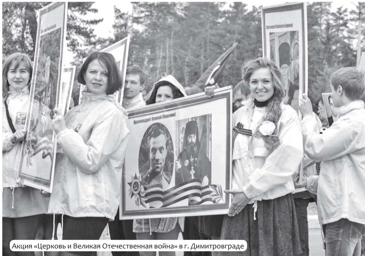
Акция «Церковь и Великая Отечественная война» в г. Димитровграде