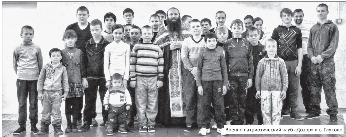
Военно-патриотический клуб «Дозор» в с. Глухово

♦ Отдел образования и катехизации Нижегородской епархии 24 марта — 24 апреля проводит конкурс детского рисунка «Мамочка — мой ангел», приуроченный к православному женскому празднику, посвященному памяти жен-мироносиц, а 17 марта — 17 апреля — среди дошкольных учреждений конкурс детского творчества «День Победы глазами детей». Положения о конкурсах см. на сайте nne.ru .