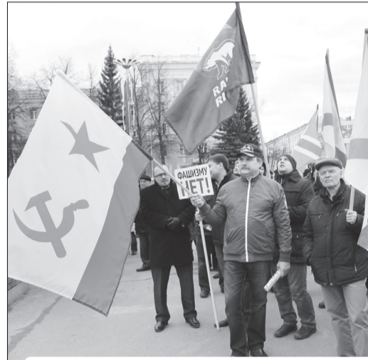
Митинг в Сарове в поддержку Крыма. 14.03.2014

Был перед постом в кино. Хожу редко, но тут с матушкой решили сходить. Тем более – известный актер ДиКаприо. Фильм «Волк с Уолл-Стрит». Что сказать о фильме? Если одежду от налипшей грязи можно легко очистить, если отравление пищей снимается таблетками или, на худой конец, «Скорой помощью», то чем отмыть мозги и сердце от мерзости, которая проникла через глаза и уши? В какой стиральной машине их можно прополоскать? Более гадкого зрелища не помню. Ушли из зала почти сразу же. А фильм на три часа. Медленно брели с матушкой по улице и пытались