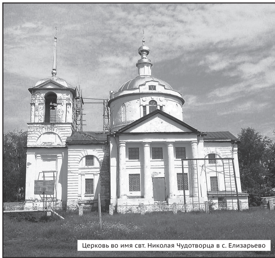
Церковь во имя свт. Николая Чудотворца в с. Елизарьево