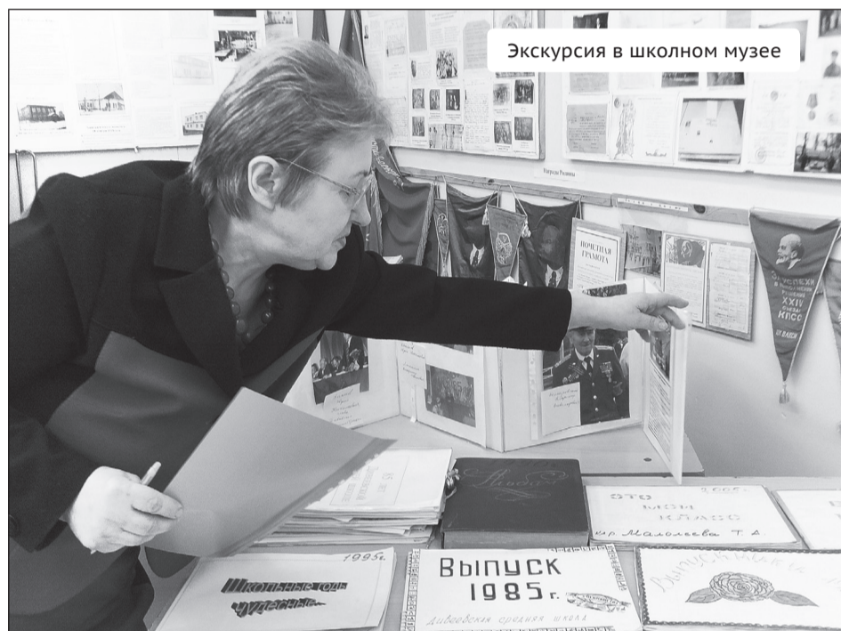
Экскурсия в школьном музее

Большое впечатление произвел доклад профессора НГПУ Т. Чирковой , она исследует феномен разрушения культуры. По ее мнению, главным фактором разрушения является «духовный вакуум» – т. е. кризис социального и национально-культурного самосознания. «Свято место пусто не бывает», поэтому полез бурьян. В перерыве я задала докладчику вопрос: «Вы красочно описали масштабы разрушения культуры, которое для России представляет национальную угрозу. В то же время, ваш вид – вполне оптимистичен. В чем тут дело?»