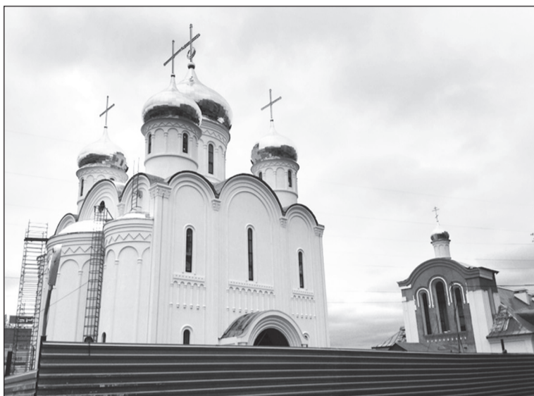
Храм Всемилошного Спаса на Пятницком шоссе

Из разговора с молодой мамой, проживающей в Москве