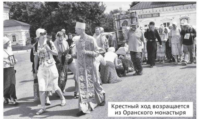
Крестный ход возвращается из Оранского монастыря

27 июня в городе Жуковский Московской области на скульптурно-производственном предприятии «Лит Арт» состоялась заливка бронзового памятника Патриарху Сергию (Страгородскому), скульптор – нижегородец Вячеслав Потопин. Памятник установят в Арзамасе, где родился патриарх. Высота памятника составит 3,6 м, а вместе с постаментом – 7 метров.