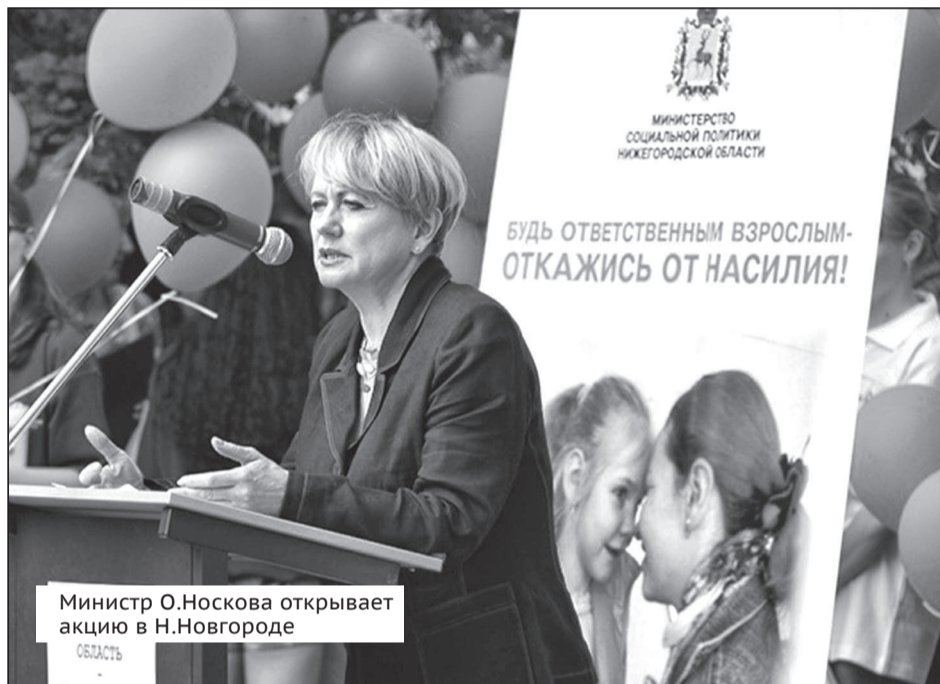
Министр О.Носкова открывает акцию в Н.Новгороде

Но вызывает тревогу то, что под видом борьбы с жестокостью сверху внедряются ювенальные технологии, чуждая нам система ценностей.