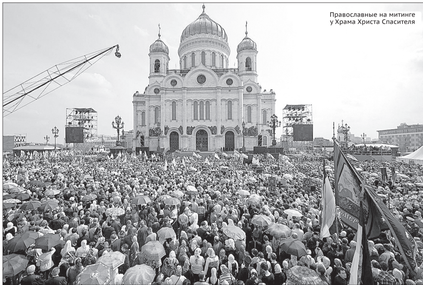
Православные на митинге у Храма Христа Спасителя