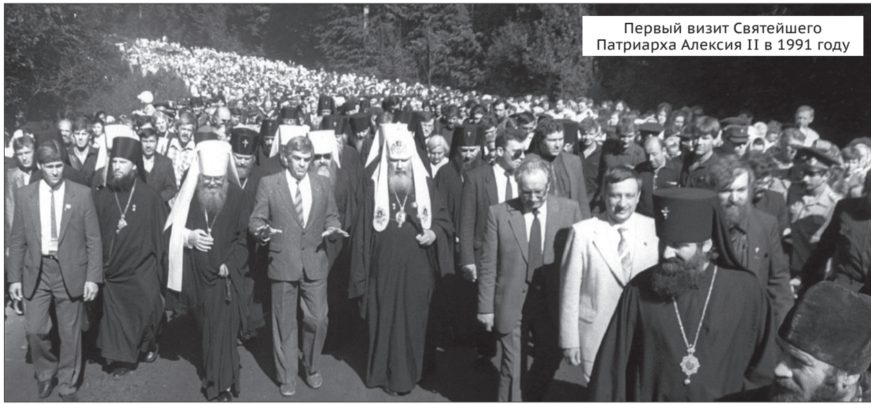
Первый визит Святейшего Патриарха Алексия II в 1991 году

Завершаем публикацию воспоминаний о том, как начиналось возрождение православия в Сарове. Начало в № 42. Вехи возрождения