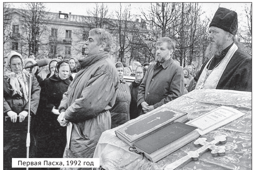
Первая Пасха, 1992 год