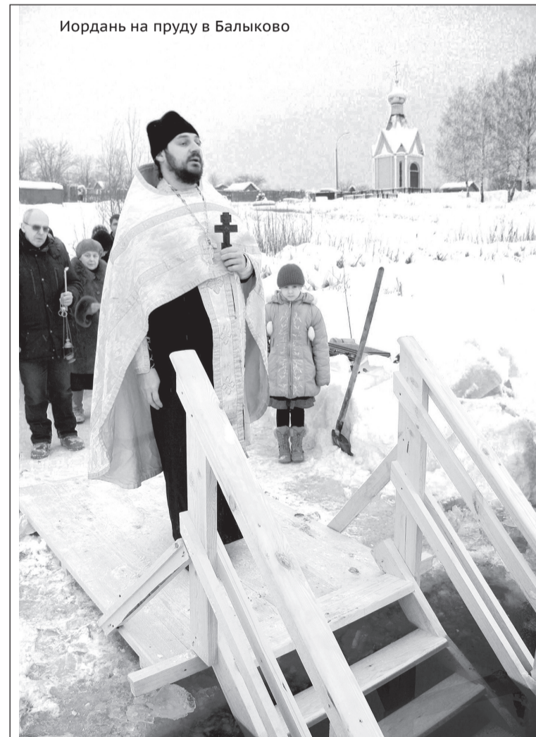
Иордань на пруду в Балыково