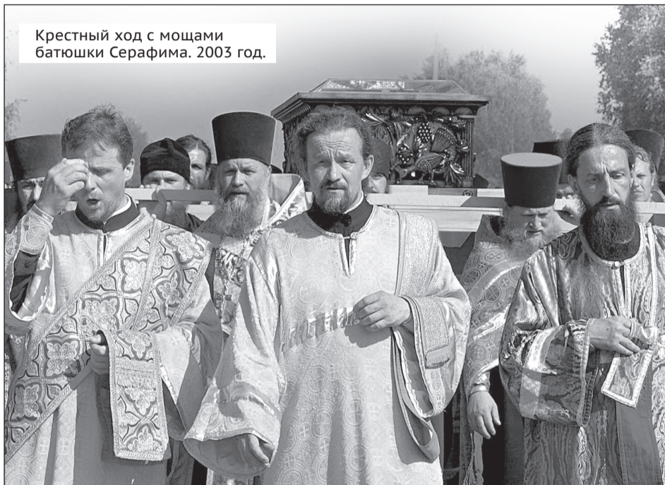
Крестный ход с мощами батюшки Серафима. 2003 год.