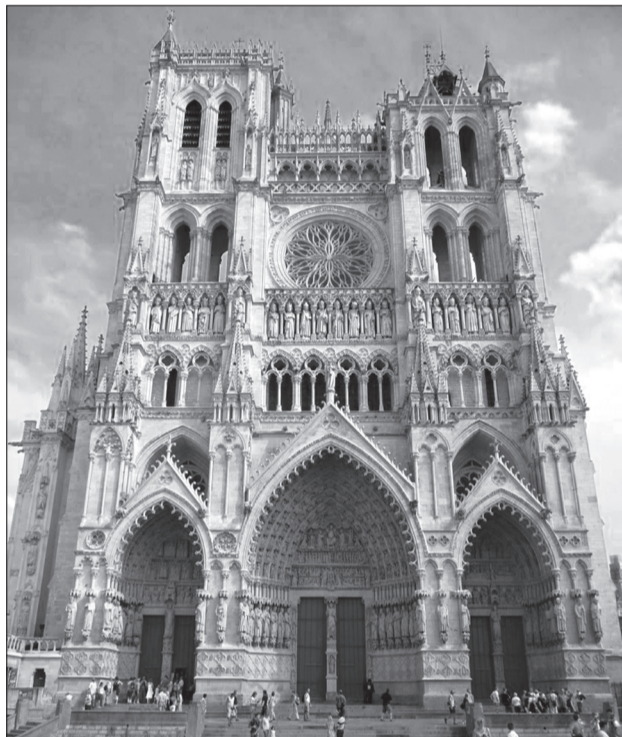
Собор в Амьене, построенный над святыней

– Да, я участвую в жизни разных приходов. Например, на всю Лотарингию, а это по площади – половина Нижегородской епархии, я – один русский священник. Там живут священники румын и француз, а ко мне, в Париж, по Интернету стекается информация о том, когда и кого