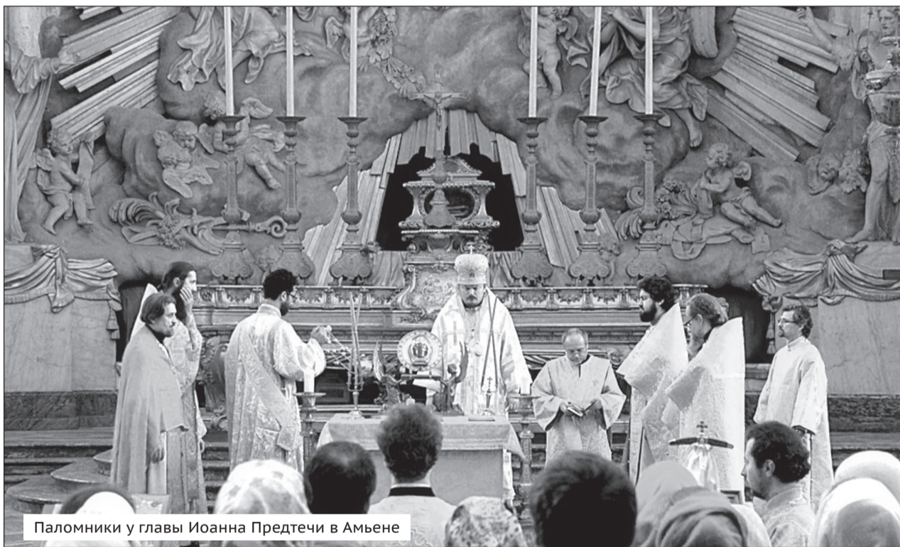
Паломники у главы Иоанна Предтечи в Амьене

– У нас, православных на Западе, появился доступ к величайшим святыням. С ними можно напрямую общаться, и это придает силы переносить жизненные