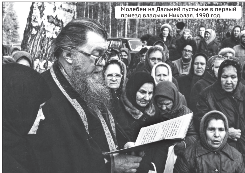
Молебен на Дальней пустынке в первый приезд владыки Николая. 1990 год.