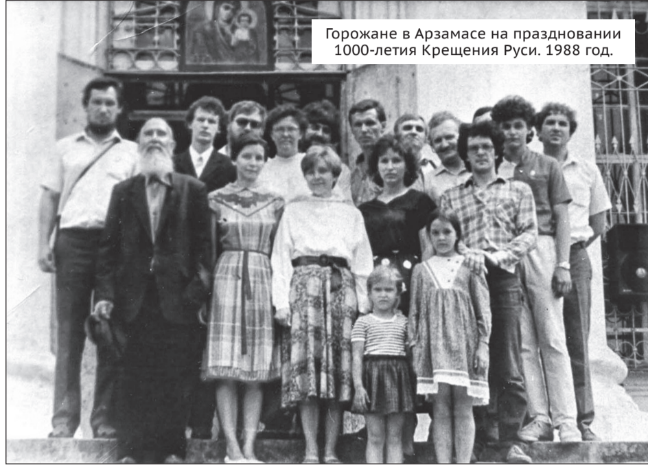
Горожане в Арзамасе на праздновании 1000-летия Крещения Руси. 1988 год.

Регистрация православного прихода в городе предполагала создание общины. На самом деле, при всей разрозненности верующих православная община, крепкая и духовно опытная, в городе была. Да и могло ли быть иначе на земле, исхоженной ножками батюшки Серафима!