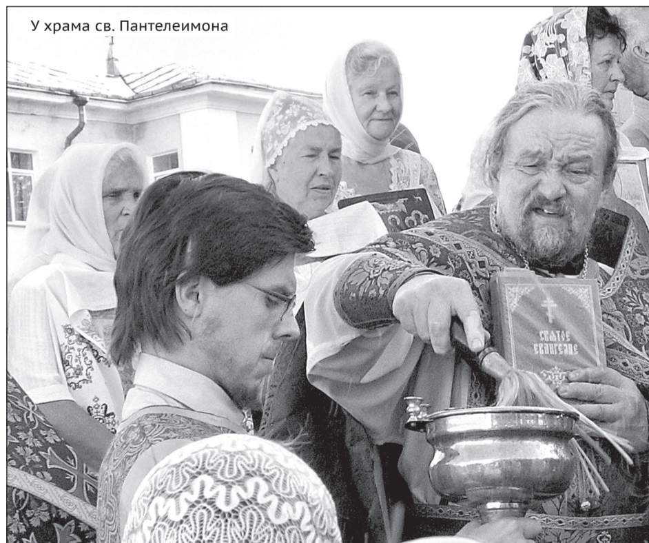
У храма св. Пантелеимона

ля Генриха I, приехала во Францию со своим двором. Нет документов, подтверждающих, что Реймское Евангелие было связано с королевой Анной, но текстологическая экспертиза подтверждает, что кириллическая часть этой рукописи – одно из самых древних славянских Евангелий. Я убежден, что оно не могло прийти ниоткуда, в духовном плане нет простых случайностей. Неужели французские короли возьмут какую-то непонятную рукопись и ради оригинальности будут на ней клясться? Ведь у них были свои прекрасные рукописи на латыни.