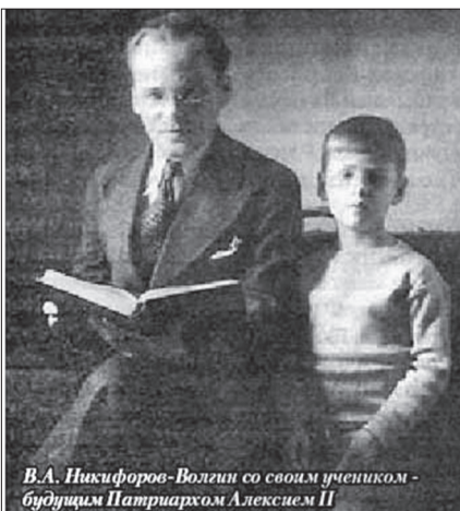
В.А. Никифоров-Волгин со своим учеником – будущим Патриархом Алексием II

Рассказ Василия Акимовича Никифорова-Волгина, написанный им в Нарве в 1926 году. Он дал название первому сборнику его рассказов, изданных в России. Писатель был расстрелян НКВД в Вятке 14 декабря 1941 года «за издание книг, брошюр и пьес клеветнического, антисоветского содержания».