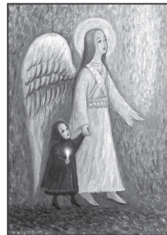
картина Елены Войцовой

Билеты можно приобрести: в храме св. Пантелеимона, церковной лавке, кассе Художественной галереи, на цокольном этаже т.ц. Плаза