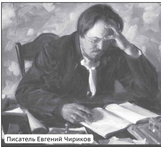
Писатель Евгений Чириков

Как сообщил сайт Нижегородской митрополии, 18 декабря в Нижнем Новгороде в Сормовской православной гимназии имени святого евангелиста Иоанна Богослова открылся «Музей русской интеллигенции, духовенства и купечества» имени Евгения Чирикова.