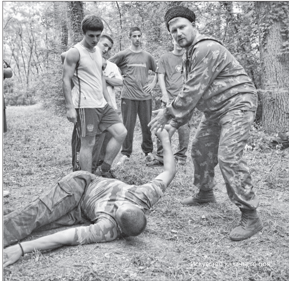
Искусство казачьего боя