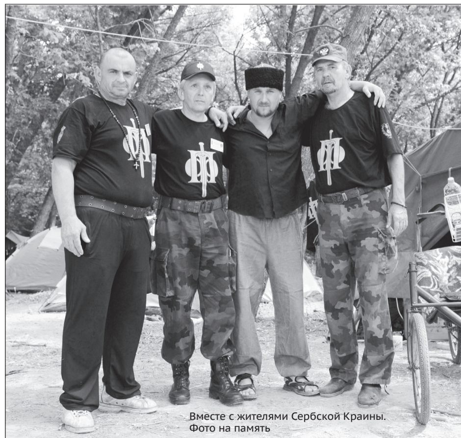
Вместе с жителями Сербской Краины. Фото на память

Мы совершили разведывод (или рейд) с целью научить правильному скрытному передвижению по лесу и полям, правильному построению группы, передвижению группой по лесу ночью, умению обращаться с картой и компасом, ориентированию на местности. Мы собирались изучить различные виды ориентиров (точечные, линейные, плоскостные), а также условные команды и сигналы.