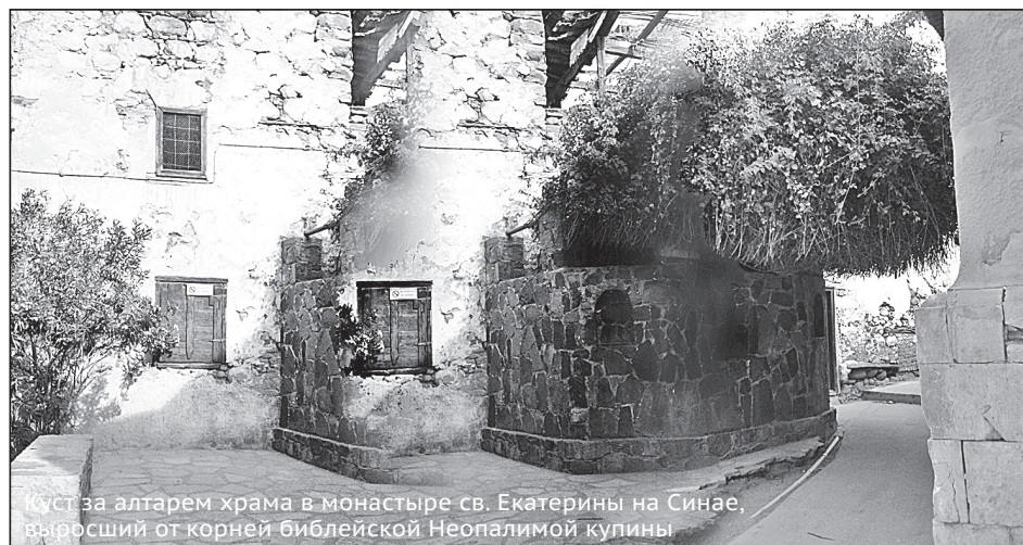
Куст за алтарем храма в монастыре св.Екатерины на Синае, выросший от корней библейской Неопалимой купины

Надежда Дмитриева. Из книги «О тебе радуется»