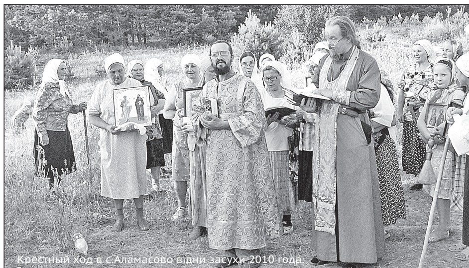
Крестный ход в с.Аламасово в дни засухи 2010 года

Мария Ивановна Павлунина