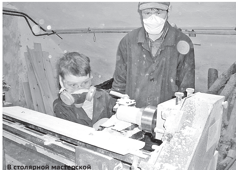
В столярной мастерской

Еще одна традиция – коллективная молитва. По благословению нашего духовника