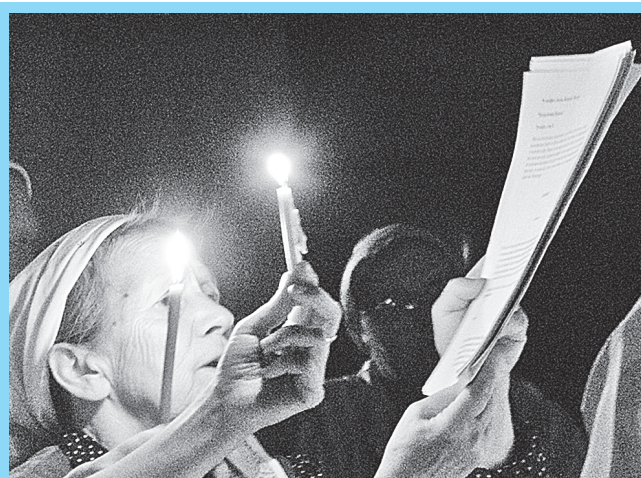
Ночной молебен с акафистом иконе «Неопалимая купина» у камушка прп. Серафима. 7 августа 2010 года.