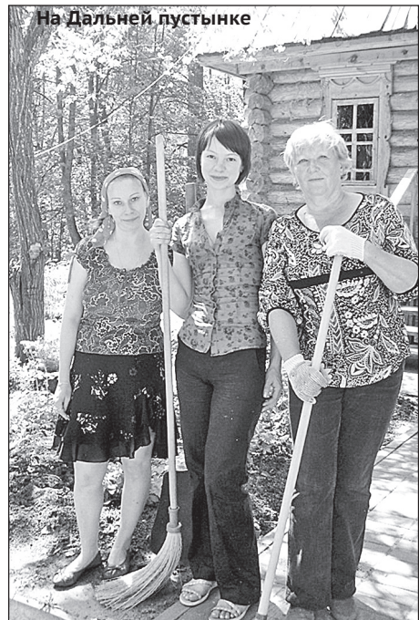
На Дальней пустынке