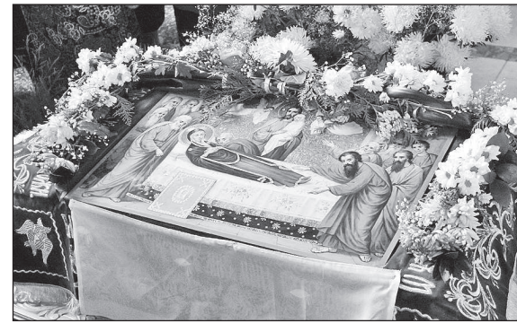
Плащаница Божией Матери

В канун праздника после богослужения в Спасо-Преображенском соборе, где покоятся честные мощи святых основателей обители, Святейший Патриарх обратился к верующим с Первосвятительским словом. В частности, он сказал: «Я часто вспоминаю Соловецкую обитель, близкую моему сердцу, братию и скиты острова Анзер, а сегодня утром я имел возможность освятить храм в Савватиевском скиту, который погрузил меня в воспоминания, связанные с жизнью моего деда, заточенного на Соловки и за веру в Бога, и за верность Патриаршей Церкви, и за неготовность скло-