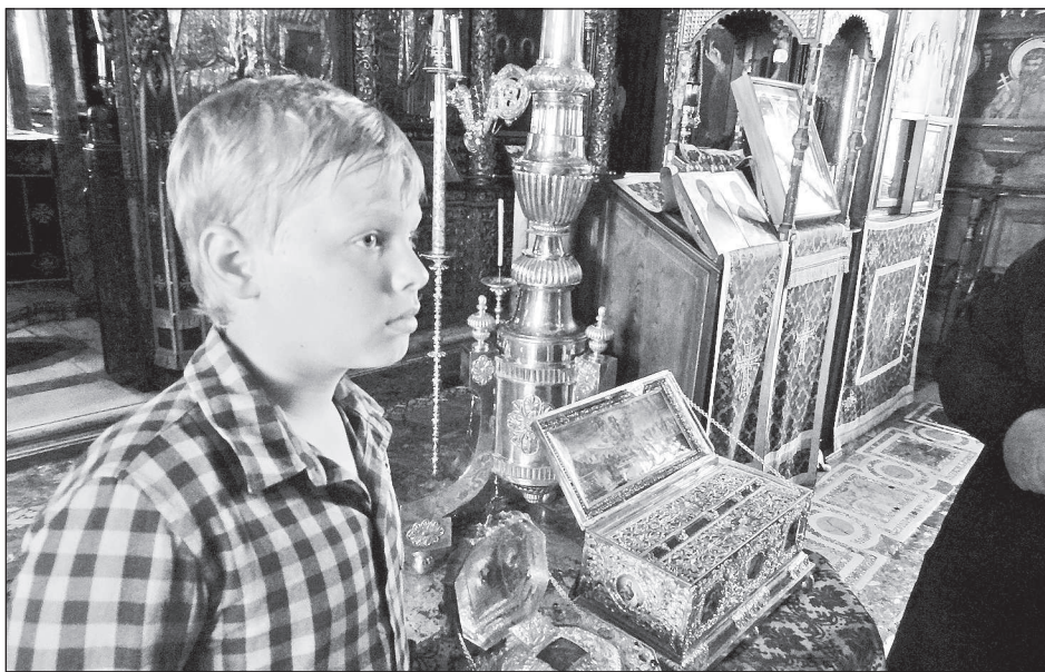
У ковчега с Поясом Пресвятой Богородицы

Далее посещаем скит пророка Илии и три монастыря: Пантакратор, Филофей