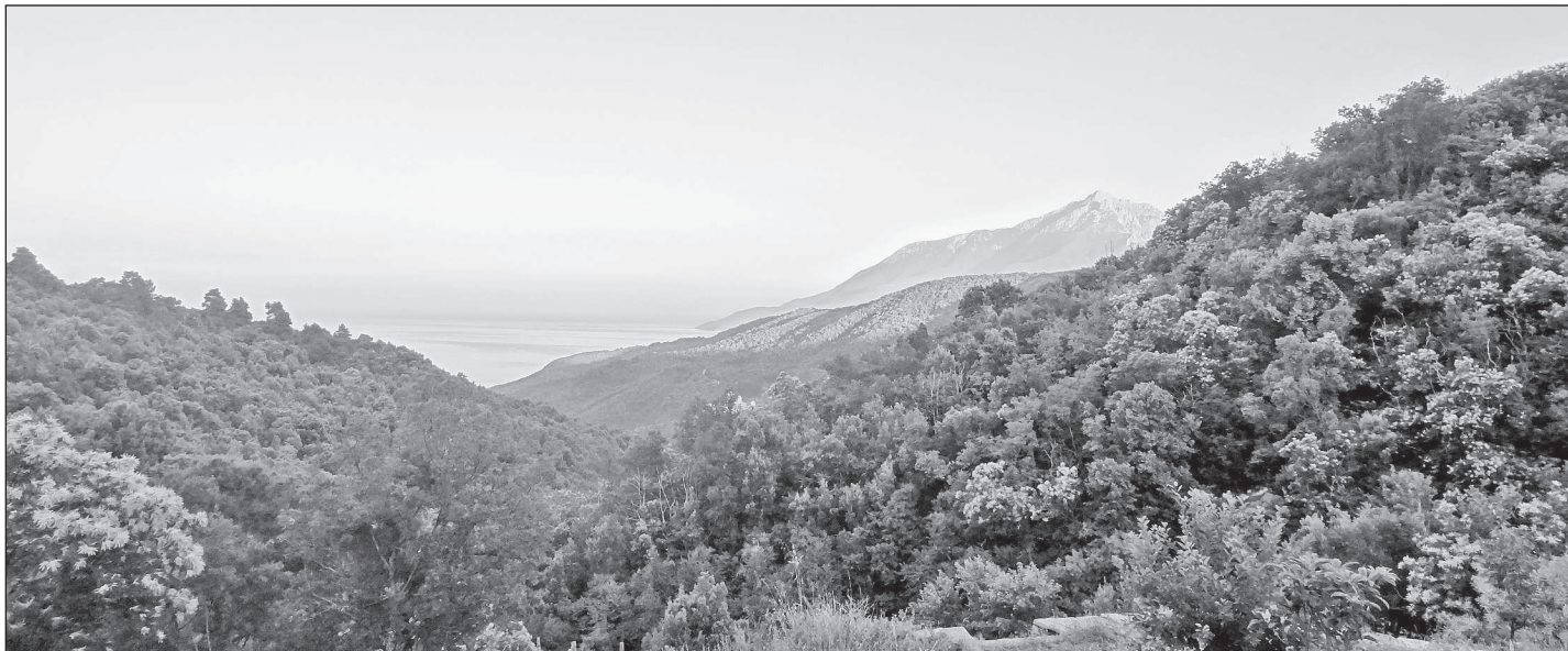
Вид на гору Афон

Теперь едем к о.Симону в скит Ксилургу. Но это название здесь не в ходу. Когда останавливаемся перед шлагбаумом при въезде на территорию монастыря Ватопед, водитель говорит привратнику как пароль: «Богородица». Так называют скит на Афоне все, иначе могут не понять: «ксилургу» по гречески «древотелец», а столярка есть в каждом монастыре. Место, куда мы едем, особое: по преданию, это – древнейшая русская обитель в мире, основанная в X веке в честь Успения Богородицы дружинниками просветительницы Руси, святой равноапостольной княгини Ольги, принявшей крещение в Константинополе. Первым делом направляемся в храм и передаем икону прп. Серафима, которую привезли в подарок. Знакомимся с о.Симоном. Высокий, стройный, движения порывистые и точные, такая же манера говорить. Держит себя просто, и очень быстро возникает чувство, что знал его давно, может, даже где-то видел. За завтраком обсуждаем с ним планы. Наше стремление посетить в первую очередь Пантелеймонов монастырь и Великую Лавру не находят у него поддержки. Времени у нас очень мало, а Лавра находится в стороне от остальных обителей, к рус-