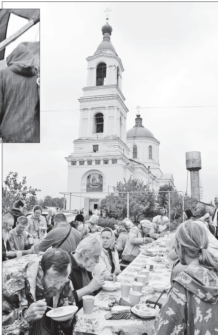
Поминальная трапеза по Дуношке с сестрами