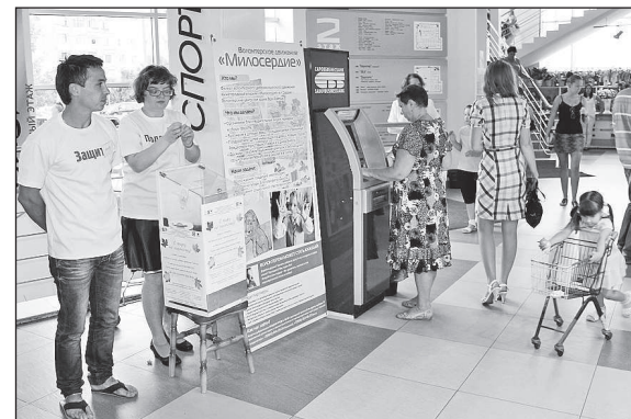
Сбор средств в ТЦ «Плаза»