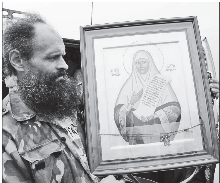
Почитание Анны Вырубовой – монахини Марии