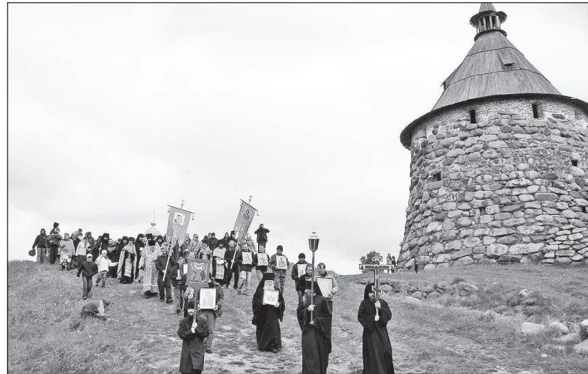
Крестный ход в Соловецком монастыре