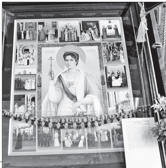
Икона царицы Александры Новой