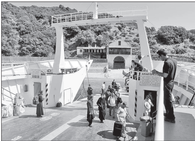
Прибытие в монашескую республику