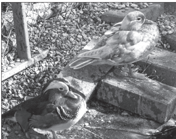
Утки-мандаринки из Спасского монастыря г.Мурома – символ верности

Мы беседовали о делах семейных, о компромиссах между родственниками, верующими в разной степени. Но разговор все время возвращался к их единственной дочери, которая выбрала непростой жизненный путь. Она росла без проблем, послушной девочкой, окруженная любовью и достатком. Закончила школу, вуз и пришла к вере. Под ее влиянием крестились отец и бабушка,