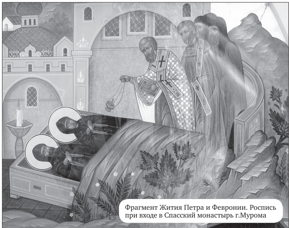
Фрагмент Жития Петра и Февронии. Роспись при входе в Спасский монастырь г.Мурома