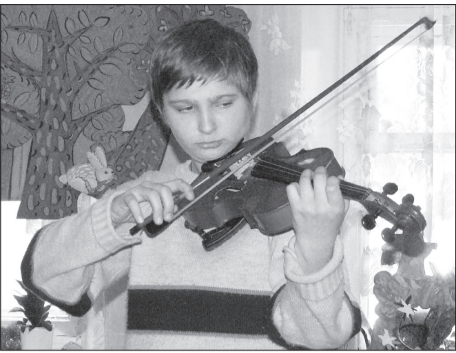
Продолжение. Начало на стр.6

как будто мы падаем на какой-то ужасный уровень бедности. Они спрашивали, как мы сможем прокормить, выучить и одеть столько детей. Тогда меня поддержал прочитанный в газете рассказ о семье из Дивеево, в которой девять детей. На недоуменный вопрос журналиста, как они живут, отец семьи ответил: «А что? Еще один ребенок – еще один черпак воды в кастрюлю с супом». На самом деле, нет этих надуманных проблем, которые представляют люди».