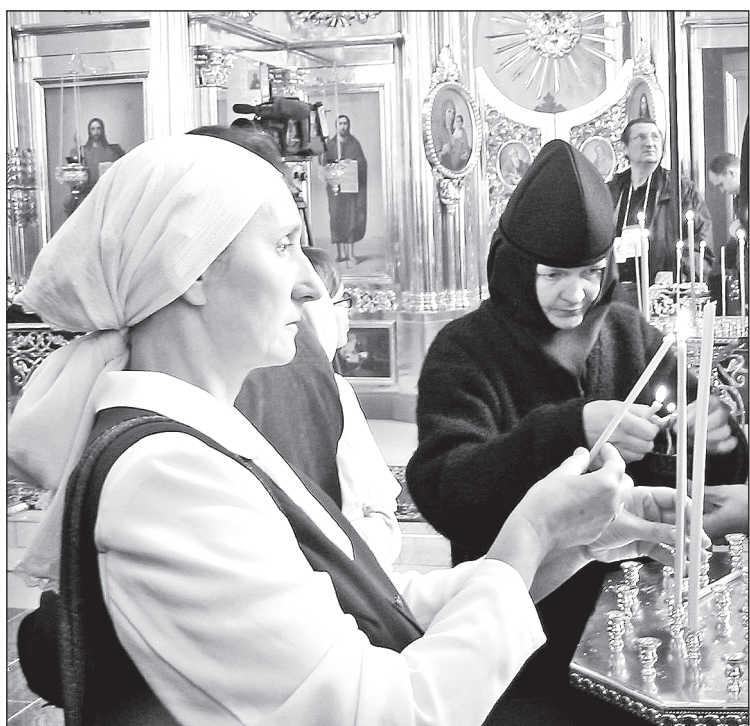
Перед освящением храма Иоанна Предтечи в 2006 году

К слову сказать, к нам в дом не раз попадали редкие по сюжету иконы, но именно такие, какие нужны. Недавно подарили икону, на которой изображены мученица Надежда и великомученица Екатерина, святые покровители дочки и внуки. Вот, думаю, какое подспорье и радость.