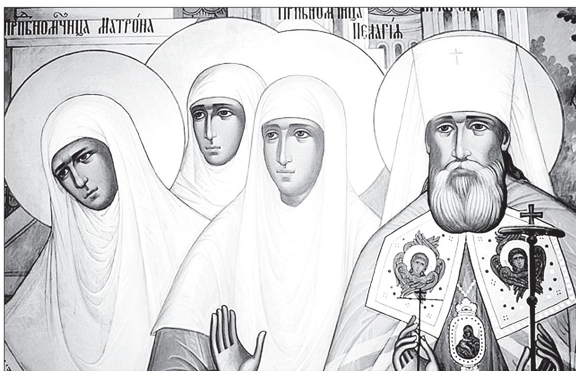
Фрагмент росписи в Казанском храме Дивеевского монастыря, в приделе в честь новомучеников

В 1922 г. В.И. Ленин в письме членам Политбюро «Об изъ-