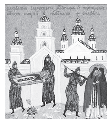
Разорение Саровского монастыря. Клеймо иконы Собора новомучеников

влением какого угодно сопротивления». И дальше его знаменитые слова: «Чем большее число представителей реакционного духовенства и реакционной буржуа-