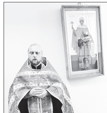
Молебен в СарФТИ

Студентов было немного, так как сейчас заканчивалась сессия, шли последние экзамены.