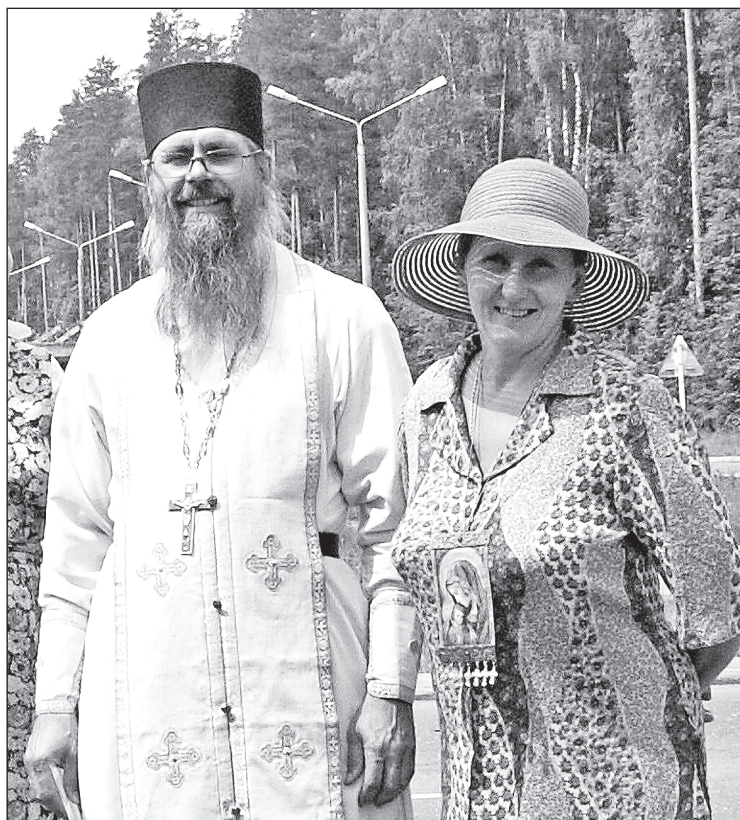
Крестный ход – всегда праздник

Подготовила М. Курякина