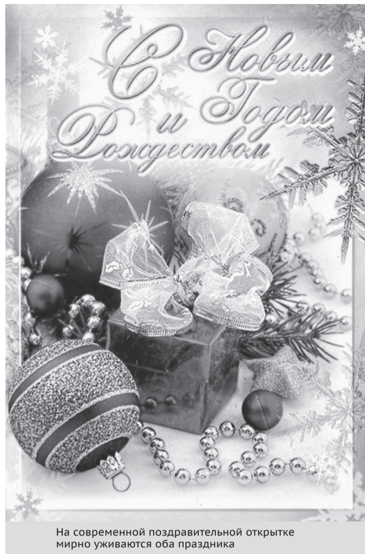
На современной поздравительной открытке мирно уживаются оба праздника

Как Новый год есть начало дней лета, то в сей день принадлежит набрать в душу такие помышления, чувства и расположения, которые могли бы, достойно христианина, заправлять всем ходом дел его в продолжение года... В духовной жизни новый год есть, когда кто из живущих в неведении начнет ревновать о спасении и Богоутрождении: ибо когда кто решается на это, тогда у него внутри и вне все перестраивается заново и на новых началах — древнее мимоходит, и все бывает ново. Если у тебя есть это — понови, а если нет — произведи, будет у тебя новый год.