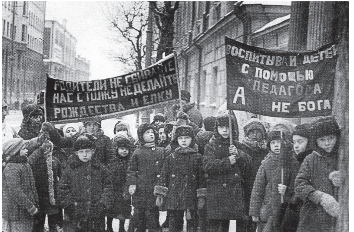
После революции Новый год и Рождество считались старорежимными праздниками. Воспитанники детских садов на антирелигиозной демонстрации. 1929 год. Москва, Бауманский район.

— Мы с мужем встречаем Новый год вместе, дома. Готовим несколько блюд постной кухни. После поздравления президента звоним родителям, друзьям, поздравляем их. Но само празднование начинается на Рождество! Мы каждый год собираемся у бабули: дочери, сыновья, внуки, правнуки, почти все с семьями. Нас у нее 20! Приготовления начинаются накануне Рождества, собираемся всем большим семейством и делаем заготовки: мамы режут салаты, бабуля ставит тесто для пирогов, ведь нет ничего вкуснее бабушкиных пирогов. Потрудились хорошо, пора и на Рождественскую службу. Она — одна из самых праздничных, торжественно-красивых! Тот, кто не по-