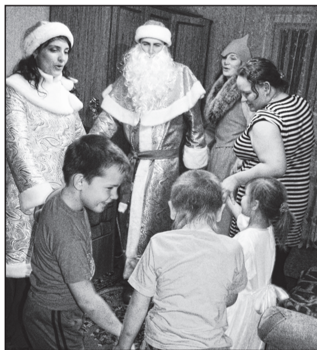
Поздравления детей на дому в 2010 году