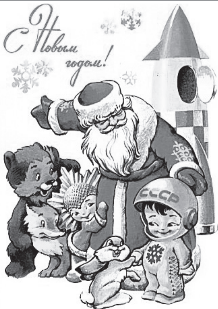
Открытка времен развитого социализма.

с радостью Причастия в новогоднюю ночь останется в моей душе до конца дней.