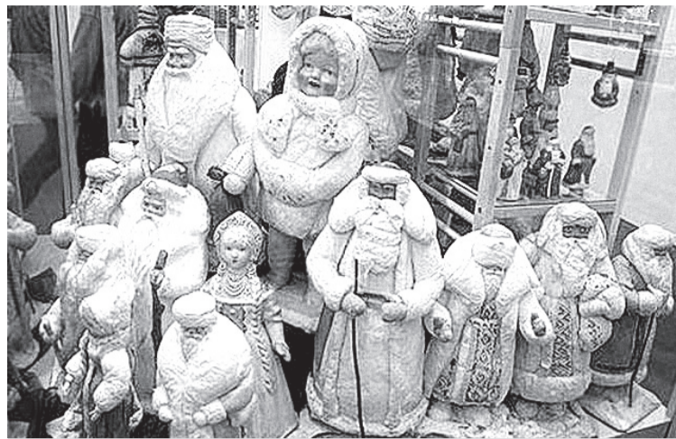
С 1935 г. в стране возобновили производство новогодних елочных игрушек. Снегурочка официально стала внучкой и помощницей Деда Мороза на новогодней елке в Колонном зале Дома Союзов в 1937 г. Деды Морозы и Снегурочки образца второй половины тридцатых годов.

После крещения в середине девяностых мы постепенно стали входить в круг церковных праздников. Впервые причиной праздника становилась не идеологически окрашенная дата, а нечто, имеющее отношение лично ко мне. Христос для каждого из нас родился, для каждого из нас воскрес. Христос ко мне пришел, он мою жизнь изменил. Однажды в праздник Пасхи я впервые за долгие годы ощутил знакомое по детству и такое дорогое ощущение встречи с чудом, какое было при встрече с Дедом Морозом. Сейчас-то я знаю, что это чудо имеет имя — Любовь. Так по-