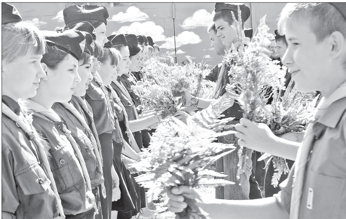
Летний лагерь. Мальчики дарят девочкам цветы в день св. Ольги