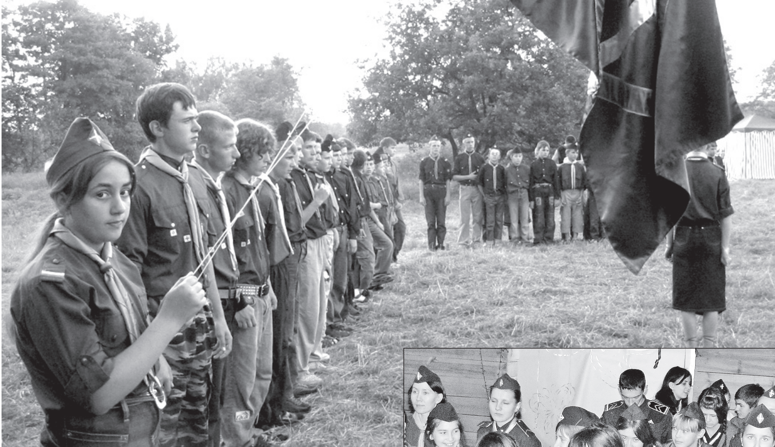
Торжественная линейка и подъем флага – необходимые атрибуты витязей

4 декабря в Ардатове состоялся ежегодный сбор Национальной организации витязей (Н.О.В.), так называемый «парад витязей». Он приурочен ко дню памяти святого благоверного великого князя Александра Невского (отмечается 6 декабря) – небесного покровителя этого движения.