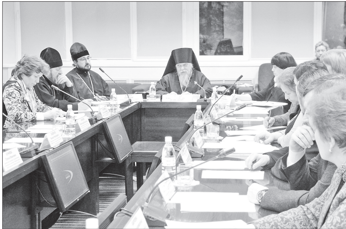
Круглый стол в Сарове «Проблемы и перспективы церковно-государственных отношений в социальной сфере»

...Надо и священникам в проповеди, и вам своими делами призывать прихожан к этому таинству любви. И не только тех, кто ходит в храм, потому что у многих очень доброе сердце. Это таинство – тоже таинство радости, которое дает удивительную благодать. Как говорил митрополит Антоний Сурожский, Господь рядом