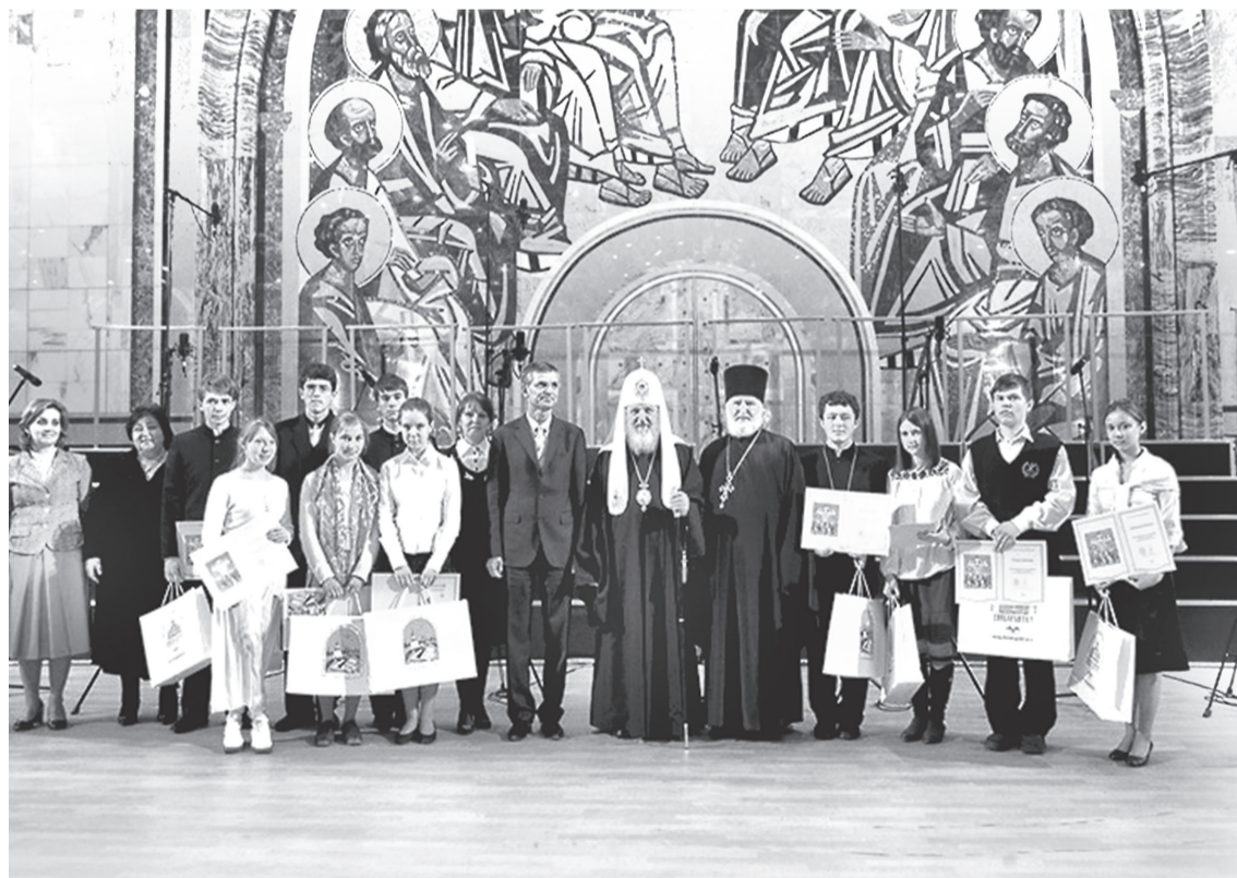
Патриарх на церемонии награждения победителей второй общероссийской олимпиады по Основам православной культуры

За более чем пятнадцать лет, что прошли с введения практики преподавания, в частности, Основ православной культуры в наших школах, уже многое сделано и во многих субъектах Федерации уже сложилась достаточно продвинутая система. Важно то, что предложения президента не предполагают сокращения всей этой уже существующей системы – как в сфере преподавания Основ православной культуры, так и в сфере преподавания Основ исламской или иудейской культуры, которые также, как известно, преподаются в наших школах в определенных регионах. Поэтому я полагаю, что период бурных обсуждений завершился и мы приступаем к важному этапу внедрения всех этих идей в образовательный процесс. Я очень надеюсь, что это внедрение будет честным, что в процессе внедрения не будет попыток откорректировать предложения президента в ту или иную сторону, что все будет проходить абсолютно прозрачно и ясно. Я думаю, что этот процесс должен идти под контролем общественности и должен, в конце концов, послужить консолидации нашего общества, повышению роли нравственного воспитания в наших учебных заведениях, формированию целостного мировоззрения, целостного восприятия жизни...»