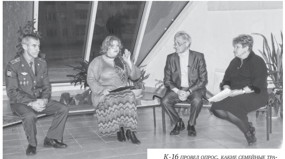
К-16 ПРОВЕЛ ОПРОС, КАКИЕ СЕМЕЙНЫЕ ТРАДИЦИИ ЕСТЬ В СЕМЬЯХ САРОВЧАН. ДЕТИ СЧИТАЮТ, ЧТО САМАЯ ЛУЧШАЯ ТРАДИЦИЯ – ЭТО СОВМЕСТНЫЕ ПРОГУЛКИ С РОДИТЕЛЯМИ.

НА САЙТЕ ГОРОДСКОГО ДЕПАРТАМЕНТА ОБРАЗОВАНИЯ ЗАИНТЕРЕСОВАННЫЙ РОДИТЕЛЬ ЗАДАЛ ВОПРОС ДИРЕКТОРУ ДЕПАРТАМЕНТА И. КОЧАНКОВУ: