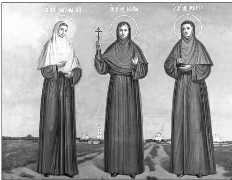
Преподобномученицы сестры Пелагия и Марфа (Тестовы) и преподобноисповедница Матрона (Власова). Роспись в Казанском соборе Дивеевского монастыря. 2 октября 2008 года там был освящен придел в их честь.

Когда я приехала в Саров, мне показалось, что здесь нет никаких национальностей, какой-то однородный «советский» народ. У нас же, в Караганде, было братство народов, сохраняющих национальный колорит. У подружки-кашанки меня угощали бешбармаком, у соседей-немцев – пирогом