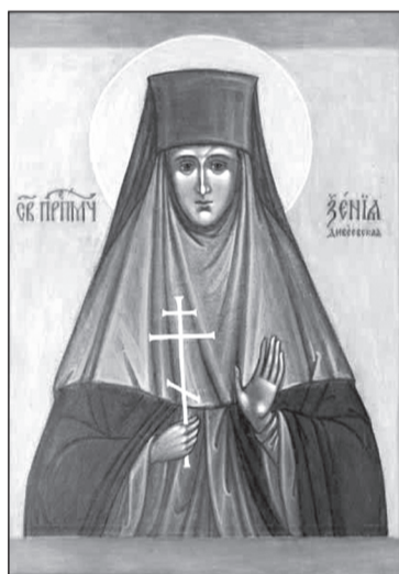
Преподобномученица Ксения (Черлинка-Брайловская) родилась в 1881 г. в Харькове. Была прославлена в числе 160 мучеников и исповедников Алма-Атинской епархии, канонизированных на Архиерейском соборе в 2000 г. Эта святая жила в Дивеевском монастыре до 1917 года, потом скиталась. С 1933 г. она отбывала 8-летний срок в Коктул-Кульском отделении Карлага. Там же ее вторично арестовали по доносу. Обвинение: «состояла в к/р группе, которая устраивала нелегальные молитвы на сопках, где выложили из камней крест, а/с агитация, ходила служить панихиду за погибших людей, к/р агитация пораженческого характера». Мать Ксению вместе с группой священников приговорили к расстрелу. Их расстреляли 15 сентября 1937 года.

Икона Спасителя в Михайло-Архангельском соборе Караганды, отразившаяся на стекле, причем с некоторыми отличиями. Напротив, на иконе Господь смотрит вверх, а на отражении – прямо.