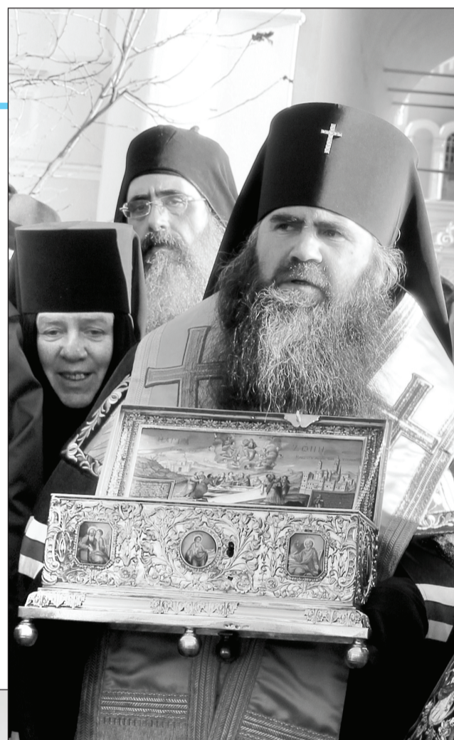
Проводы Пояса Пресвятой Богородицы в Саранск