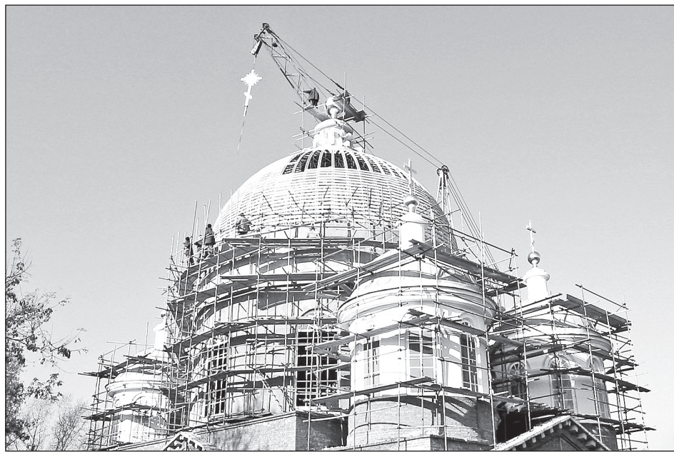
Установка креста в 2004 году