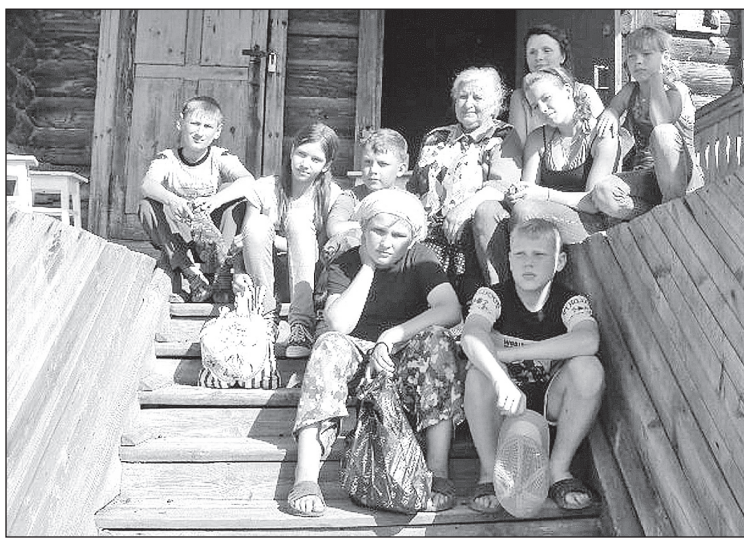
Знакомство со старожилом п. Куриха