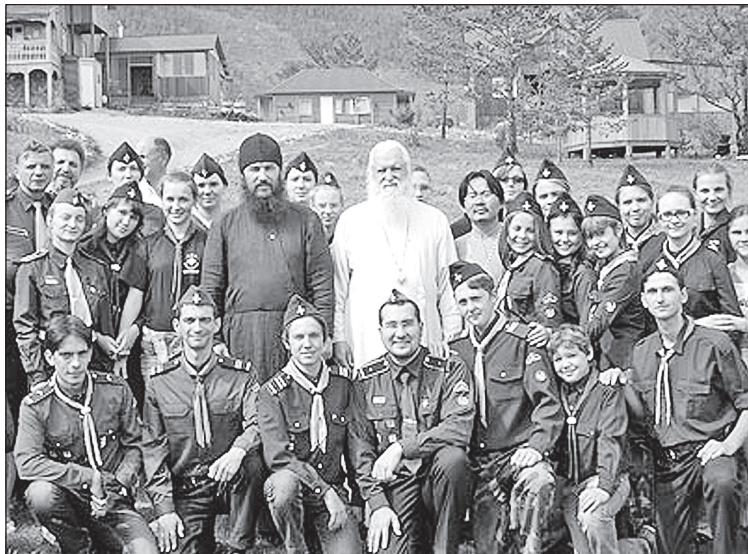
Участники международного слета витязей