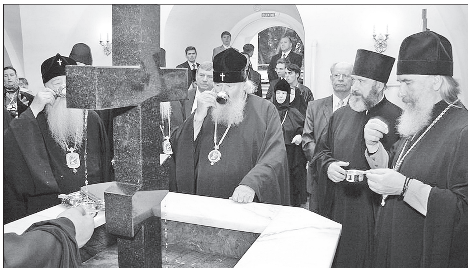
Патриарх Алексий II в приделе Илии Пророка в 2006 году

Николая). В марте 2004 года около храма Иоанна Предтечи установили строительный кран, началась работа по восстановлению барабанов и куполов с крестами. В том году храм приобрел свой первоначальный вид. Внутренняя отделка заняла еще полтора года. По сохранившимся фотографиям был восстановлен высокий золоченый иконостас, который венчают композиции Преображения, Вознесения и, в центре, Воскресения Христова.