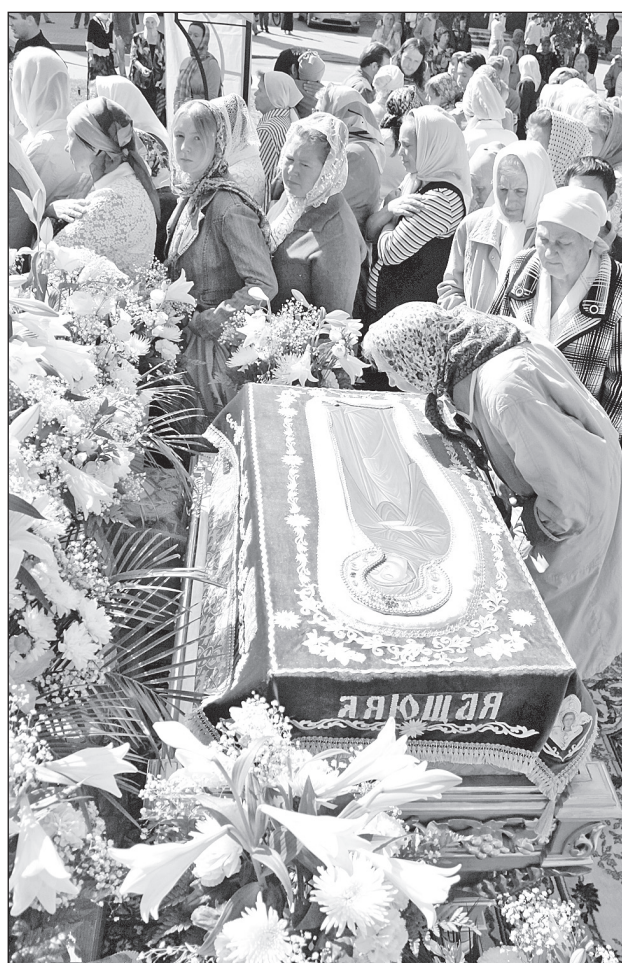
На службу пришли несколько сотен саровчан