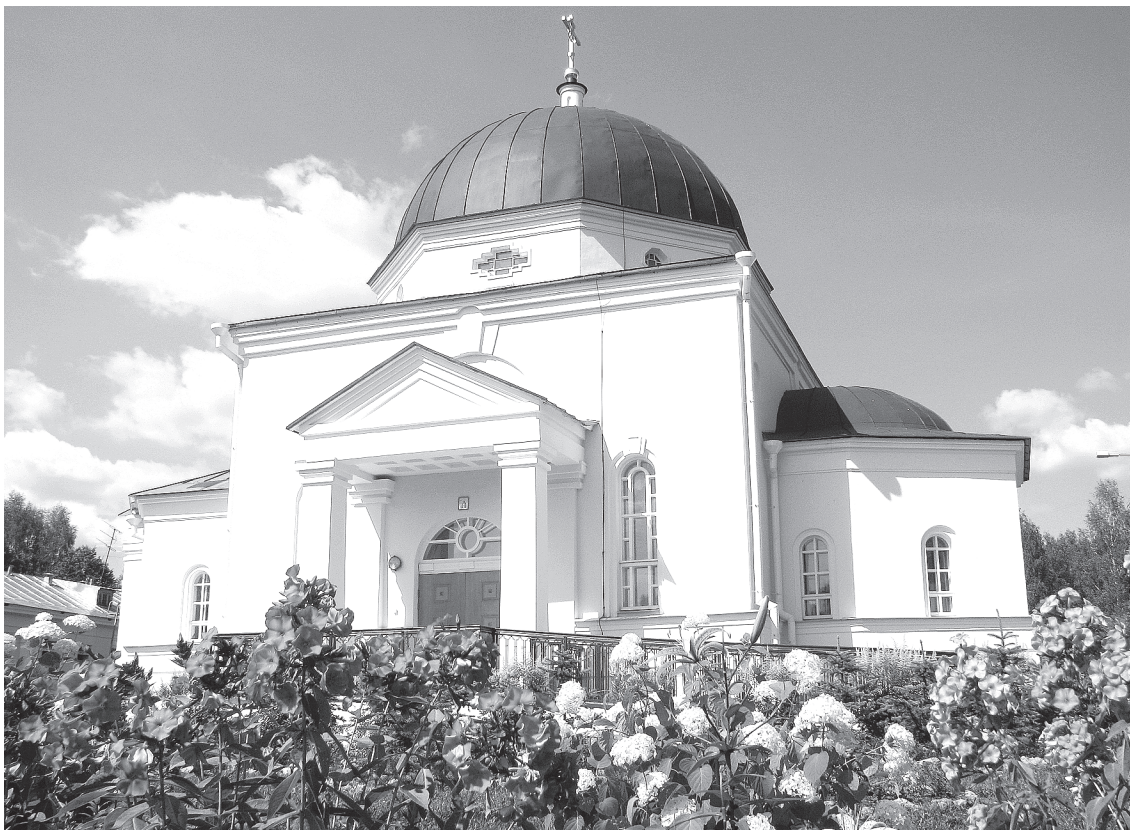
Храм в больничном городке утопает в цветах

Когда не было служб, прихожане работали с 8 утра и до 11 часов вечера при свете фонарей. Насыпали дорожки и засадили их