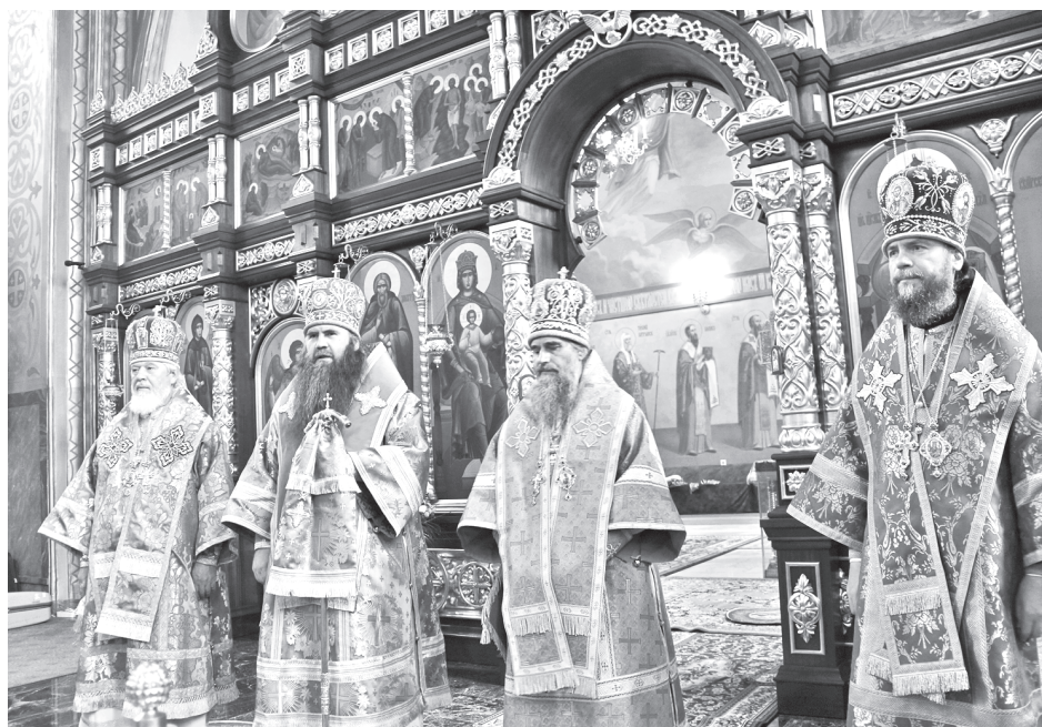
Четыре архиерея в храме Серафима Саровского

По окончании литургии, за которой было очень много юных причастников – прихожане постарались привести на архиерейское богослужение своих детей и внуков, – гости познакомились со святынями Сарова. Они побывали на месте захоронения прп. Серафима возле алта-