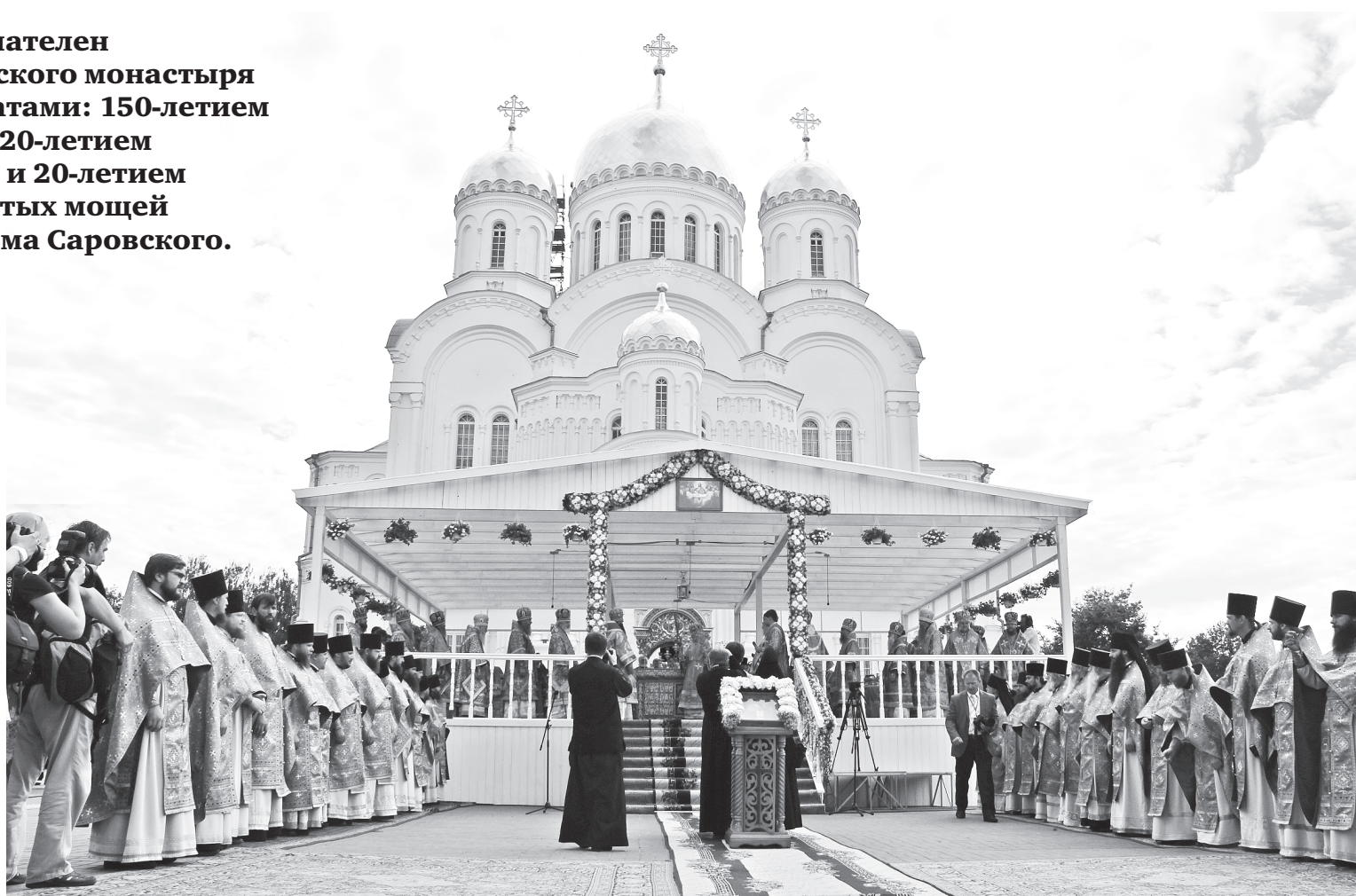
Божественная литургия под открытым небом. Соборная площадь Дивеевского монастыря

На богослужении присутствовали руководитель Государственной корпорации по атомной энергии «Росатом» Сергей Кири-