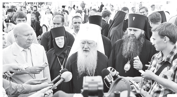
Пресс-конференция с митрополитом Ювеналием