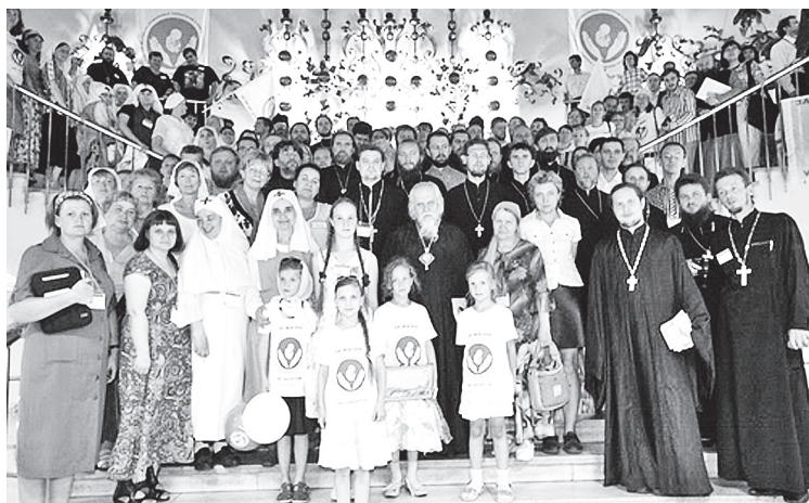
Участники международного фестиваля «За жизнь – 2011»

социальных служб в медицинских учреждениях, подготовка сеестер милосердия и добровольцев для сфер здравоохранения и социального обслуживания.