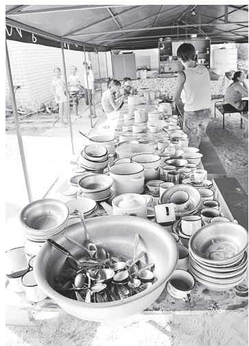
Фронт работ для дежурных