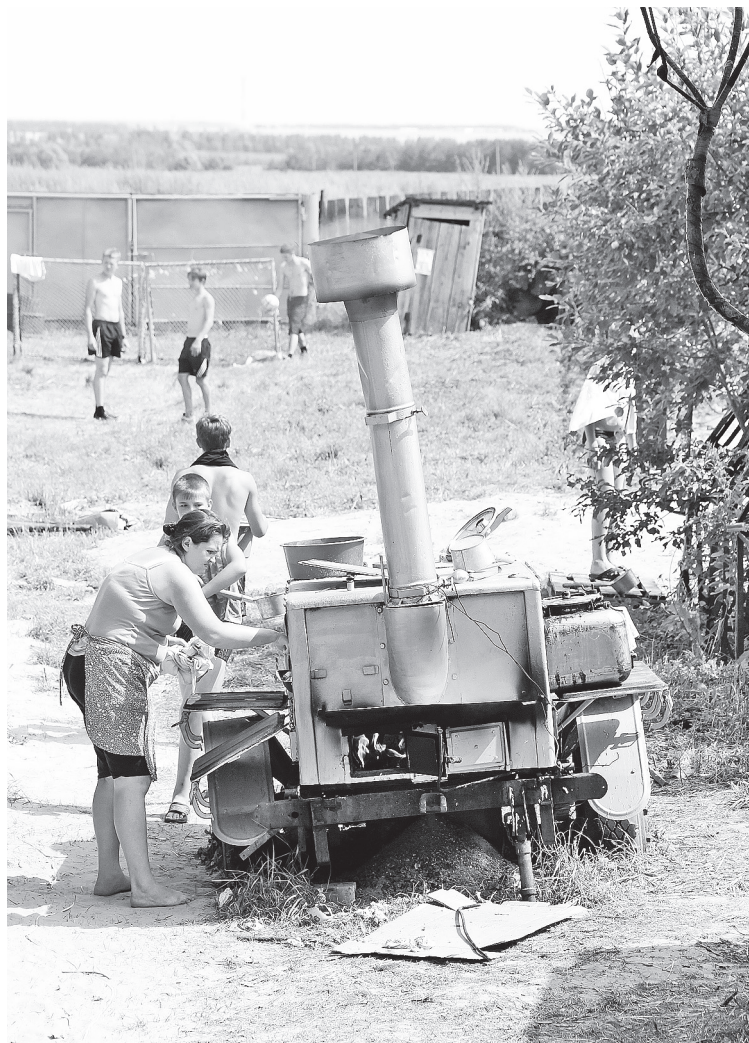
В походной кухне варится обед