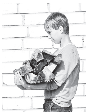
Дрова для печки

терпцев, крестный их подвиг служат нам примером. Мы с вами настолько ослабли в полусонной, полудремотной жизни, что готовы ли на какой-либо подвиг, даже не ради страны, державы, а ради самих себя? Семья императора для нас – идеальный пример, который заставляет задуматься. Существует их переписка, читая которую, понимаешь, насколько же они были целомудренны и возвышенны, насколько любили друг друга! За это предстали перед Богом и прославлены в лике святых».