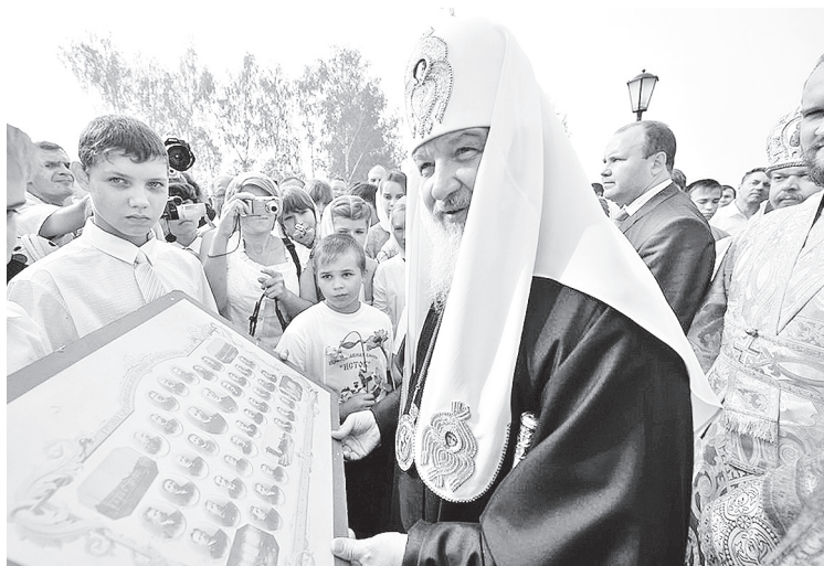
Патриарх Кирилл в Лукоянове. Июль 2011

16 июля, по окончании Божественной литургии в Патриаршем Успенском соборе Московского Кремля, Святейший Патриарх Кирилл освятил у мощей святителя Гермогена икону, написанную в преддверии юбилейных торжеств, посвященных 400-летию мученической кончины (2012 г.) и 100-летию проповедания Патриарха Гермогена в лике святых (2013 г.). С этой иконой предполагается пройти крестным ходом по пути народных ополчений Прокопия Ляпунова, Кузьмы Минина и Дмитрия Пожарского, освободивших страну от иноземных захватчиков. Затем ее передадут в дар храму во имя святителя Гермогена, который будет возведен в рамках программы строительства православных храмов в Москве.