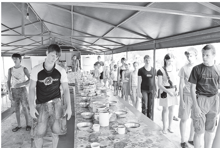
Молитва перед трапезой

Удивительное чувство испытываешь, когда «Иже херувимы...» звучат под открытым небом. Алтарь полностью просматривается. Ни одно действие священника не остается «за кадром».