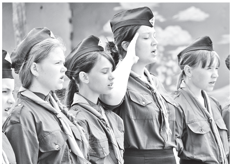
«Мы Витязи славной России...»

«Будем ли об этом писать?» – спрашиваю о. Михаила. «У нас запретных тем нет, – отвечает батюшка, – все казусы общения, которые есть в мире, прорываются и сюда. Надо это гасить. Общее падение нравов и культуры печалит. Идет развал страны, потому что нет внутренней дисциплины. Все начинается с малого. Господь говорит, что неверный в малом и в большом будет неверен. Айсберг проблем. Матерятся в семье при детях. Все это де-