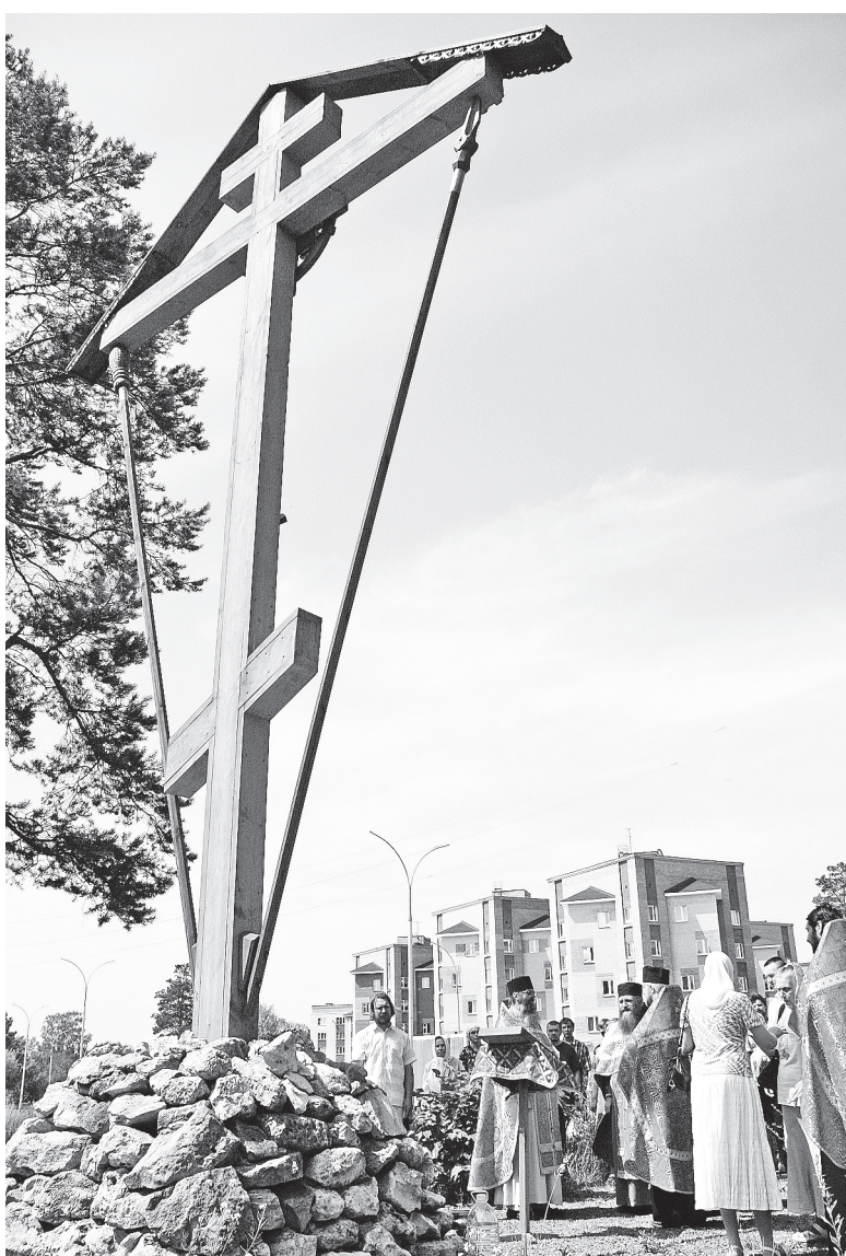
Молебен Царственным страстотерпцам 17 июля 2011 года в Сарове