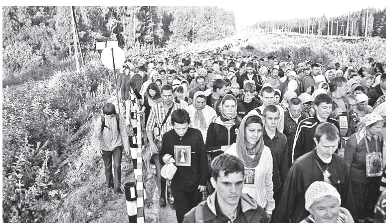
Многотысячный крестный ход на Ганину яму. Екатеринбург, 2011 год