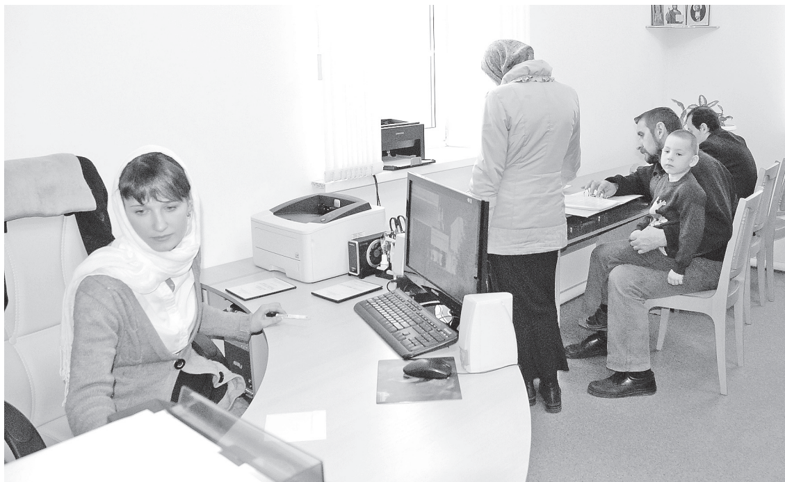
В Дивеевском культурно-просветительском центре

Когда мы приезжаем в Дивеево, первым делом спешим пройти по Святой Канавке, приложиться к мощам батюшки Серафима и святых жен Дивеевских, искупаться в источниках. Немногие знают, что в левом крыле здания Паломнического центра Серафимо-Дивеевского монастыря для всех желающих работает Культурно-просветительский центр. В Сарове ничего подобного пока нет. И неизвестно, будет ли. Поэтому нам нужно активнее пользоваться теми возможностями, которые есть в Дивееве.