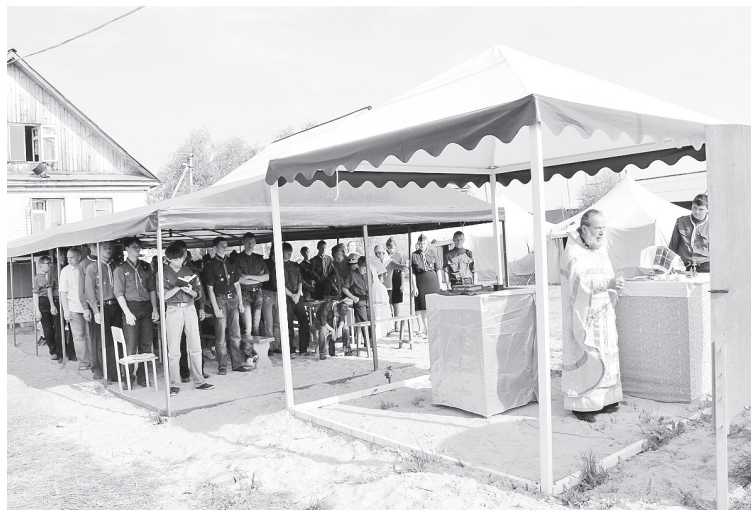
Литургия под открытым небом

структивно влияет на отношения людей и воспитание детей. Господь этого не терпит. Нельзя совмещать молитву – словословие Богу – и одновременно обращаться антимолитой к дьяволу. Мат – призывание нечисти. Матерная брань пронизана совершенно противоположной агрессивностью и похотливостью. Матерящиеся люди воспроизводят в тонком пространстве все, о чем говорят. Недаром Господь уделяет этому глубочайшее внимание и предупреждает: «От слов своих осудишься и оправдаешься». Мат не только искажает пространство, но и других возвращает. А в народе царят извращенные суждения. Не раз подходили ко мне и спрашивали: «Если нечистого видишь, как от него защититься?» Говорю: «Крестом и молитвой». А мне в ответ: «А вот бабушки говорят, что нужно его крепко выматерить, и он исчезнет». Конечно, исчезнет, раз своего добился. Но ведь есть разница: или с ужасом и болью от крестного знамения нечистый уйдет, или злорадствуя. К сожалению, даже некоторые священники допускают матерную брань. Говорят, «вырвалось». Но если вырвалось, значит, внутри живет. Внутренняя духовная дисциплина отсутствует».